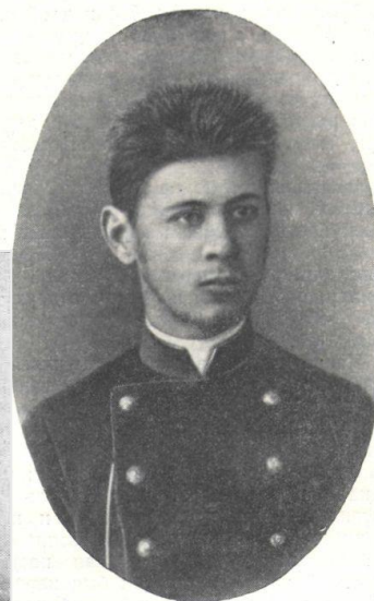
М. П. Чехов. Фотография 1889 г.