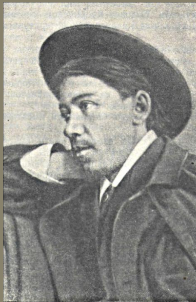
Н. П. Чехов. Фотография 1880-х годов.