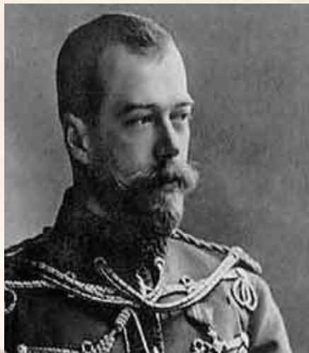
Николай II (1894-1917 гг.)