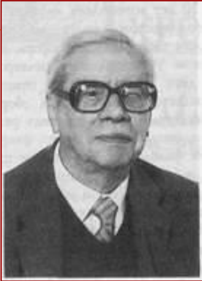
Николай Максимович Шанский

«На примере сложноподчинённого предложения можно проследить, как человек выражает отношения между миром и собственной точкой зрения»