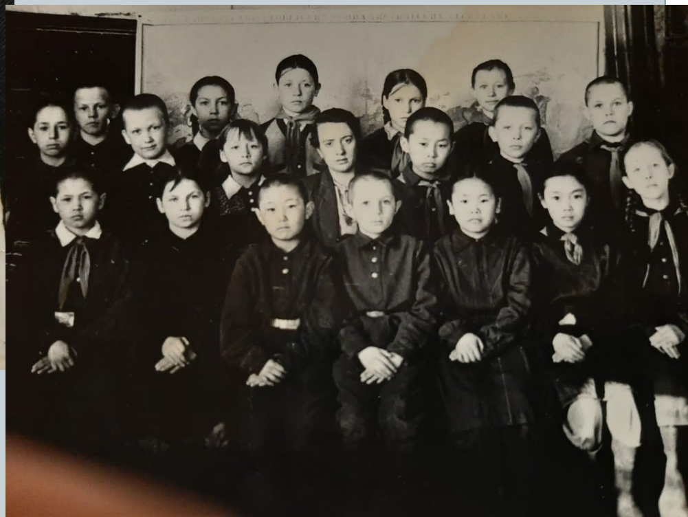
Батамайская начальная школа;