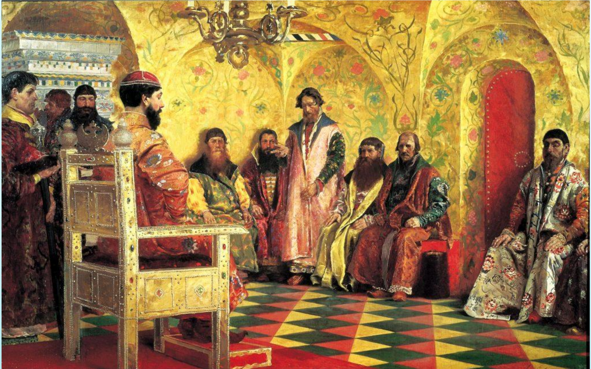
Рябушкин А. П. «Сидение царя Михаила Федоровича с боярами в его государевой комнате»»