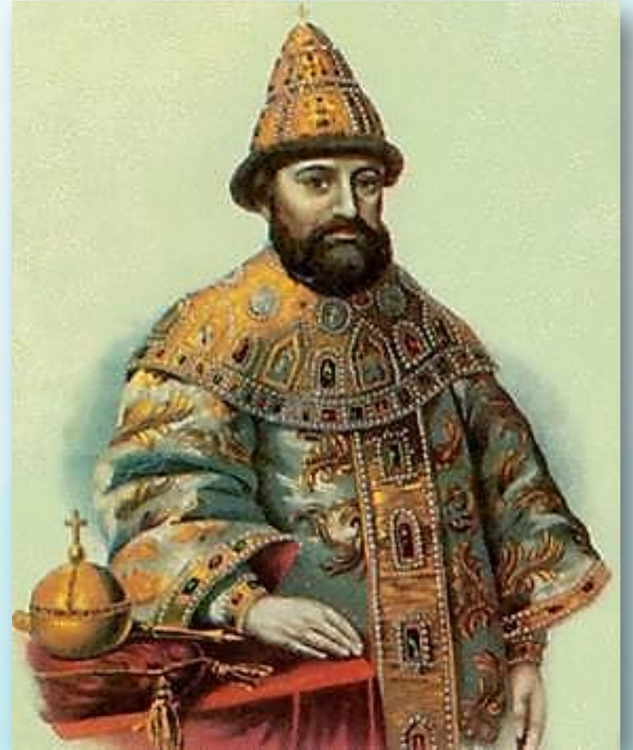
Михаил Федорович «Кроткий»