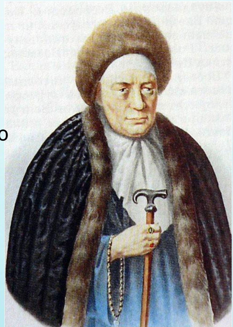
Ксения Романова (Шестова)

В первые годы царствования Михаила (1613-1619) реальная власть находилась у его матери, а также у ее родни из бояр Салтыковых.