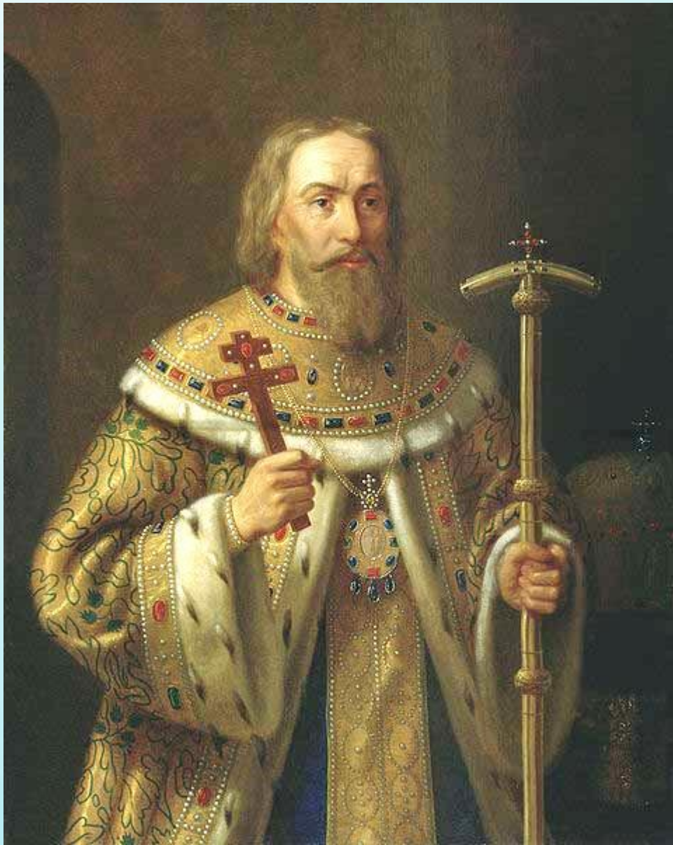
Патриарх Филарет. Художник Н. Тютрюмов