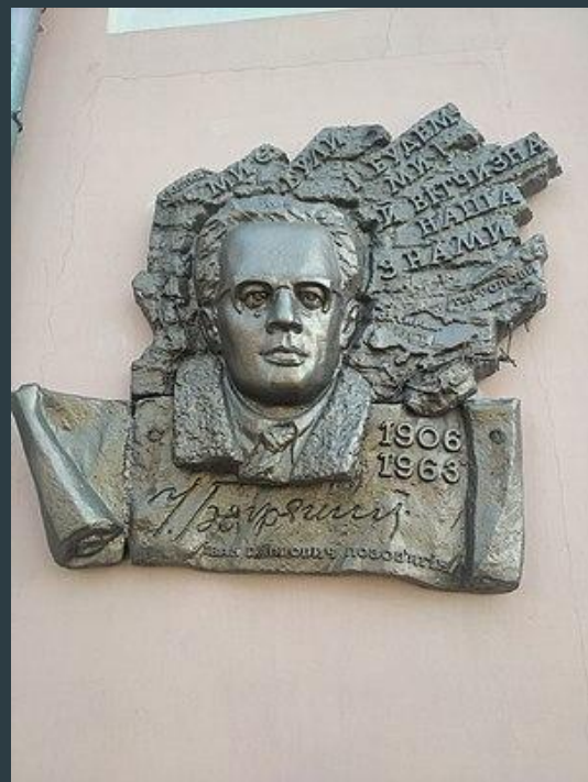
Меморіальна дошка в Охтирці