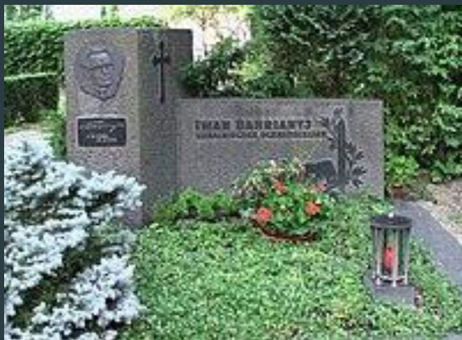
Могила Багряного у м.Новий Ульм (Німеччина)