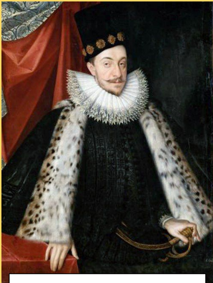
Сигізмунд III (1587 – 1632 рр.)