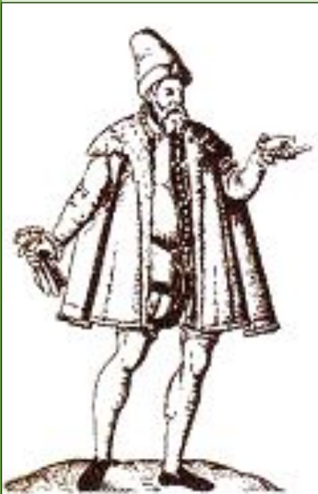
Польський купець. Гравюра XVI ст.

Міщани – сплачували податки, були обмежені в праві обіймати державні посади.