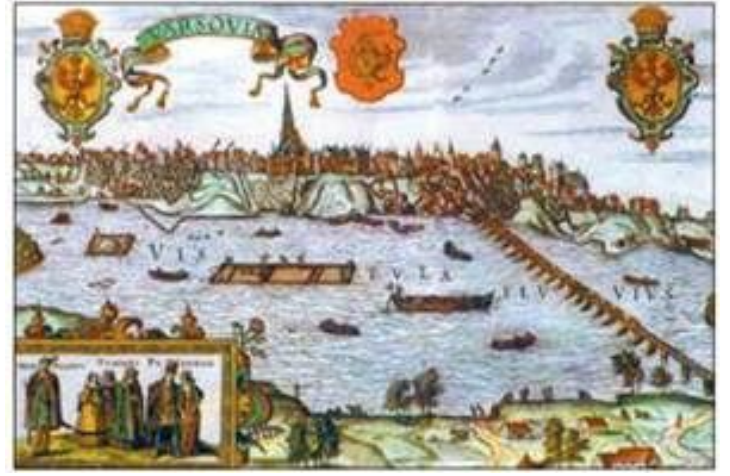
Варшава на початку XVI

• Багатонаціональна держава: включала польські, литовські, українські, пруські землі, частину