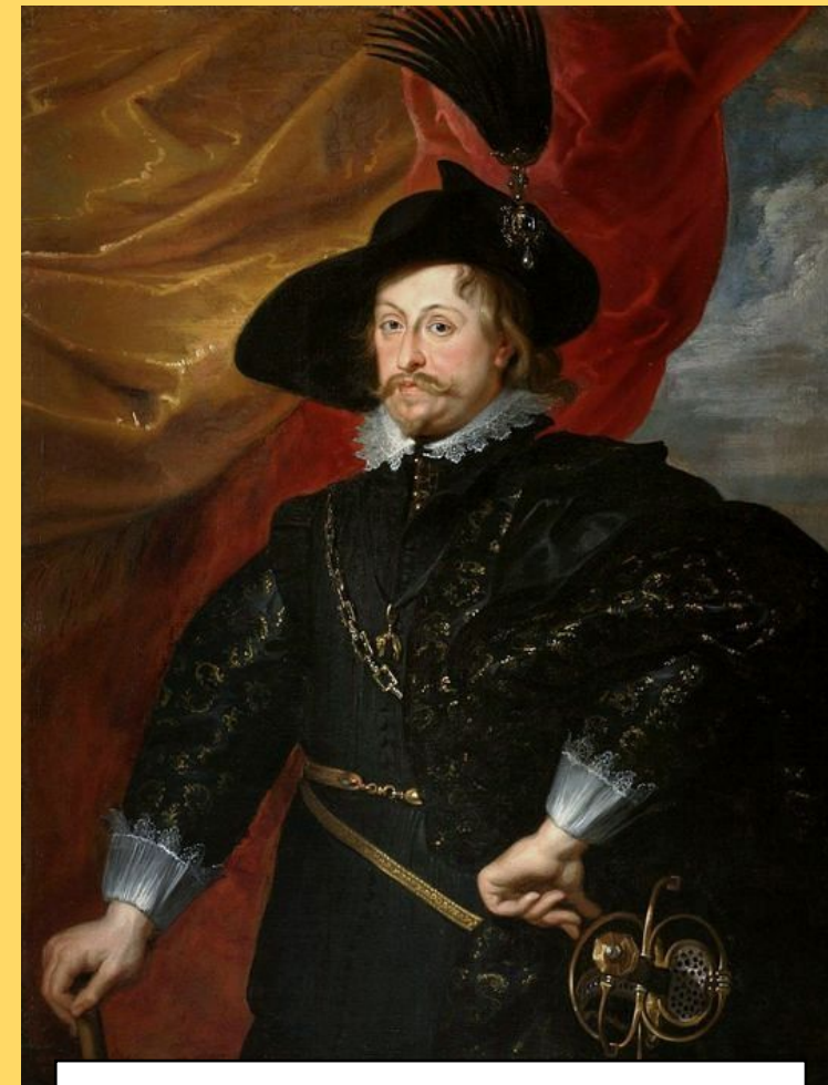
Владислав IV (1632 – 1648 рр.)