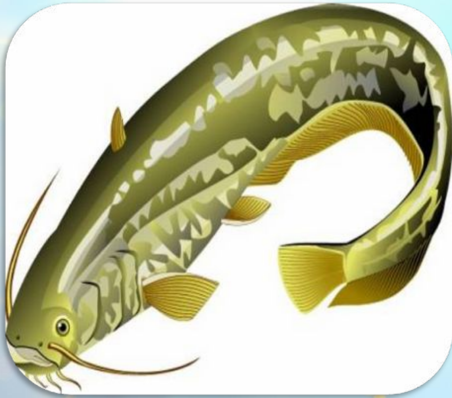
С О М