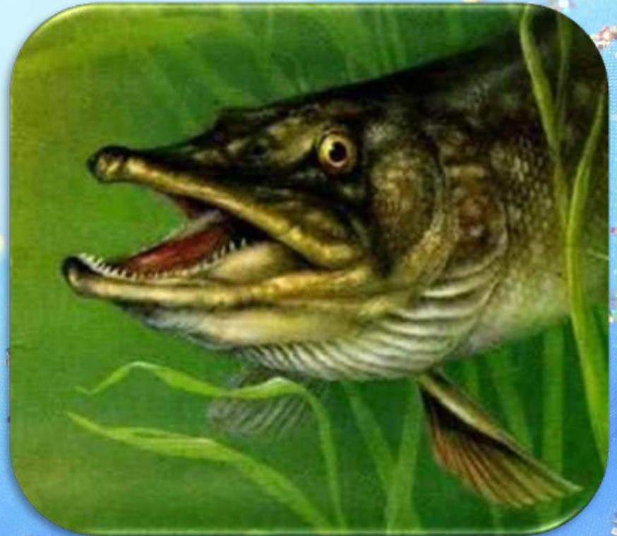
щ у к а