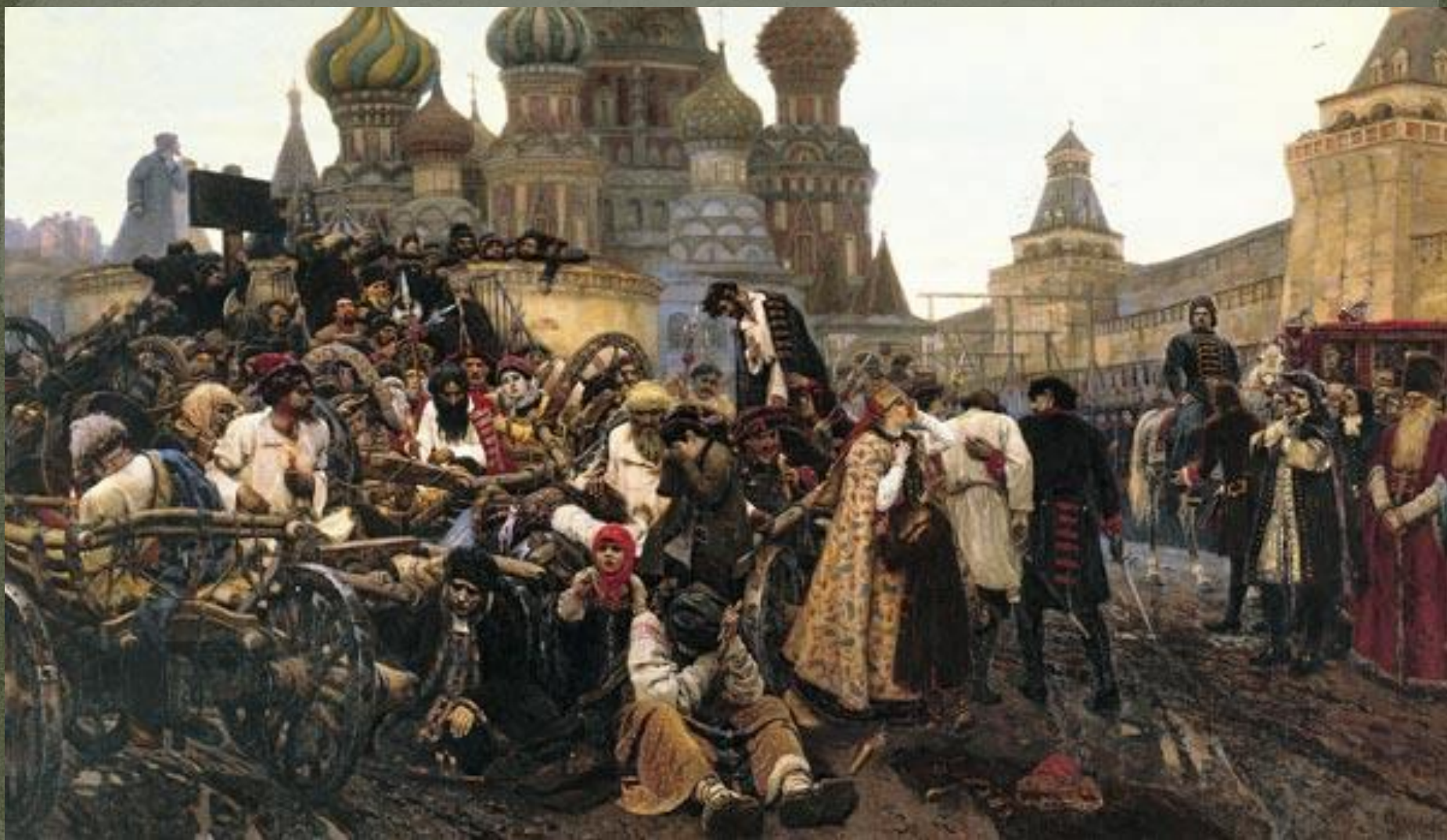
В.И.Суриков «Утро стрелецкой казни»