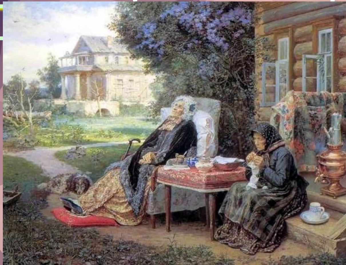
В. М. Максимов «Всё в прошлом»

Что бы вы изменили в сюжете картины, если бы это были ваши близкие?