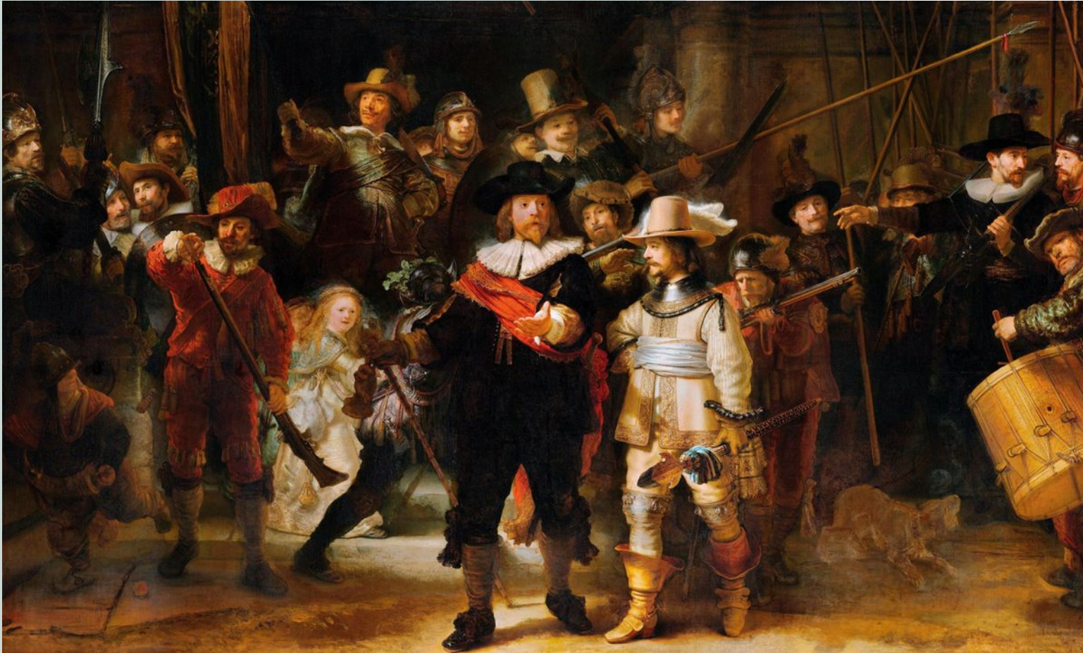
"The night Watch" Rembrandt 1642