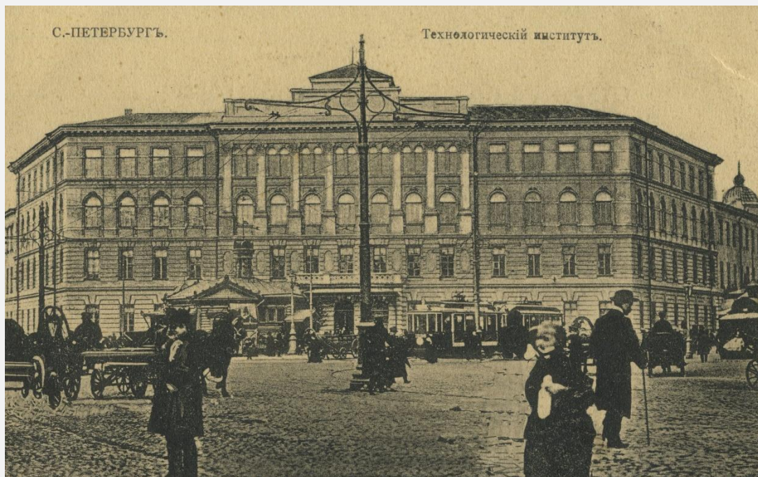
Петербургский технологический институт (1862)