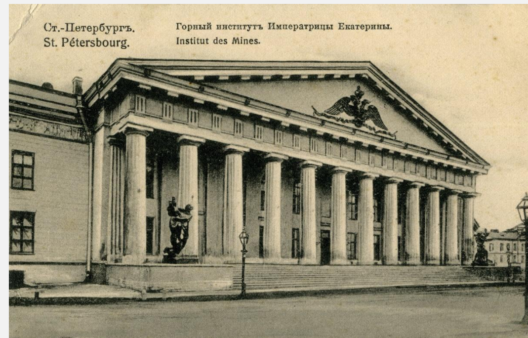
Горный институт (1866)