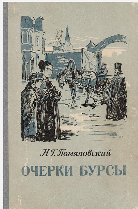
«Очерки бурсы» (1862) Н.Г. Помяловский