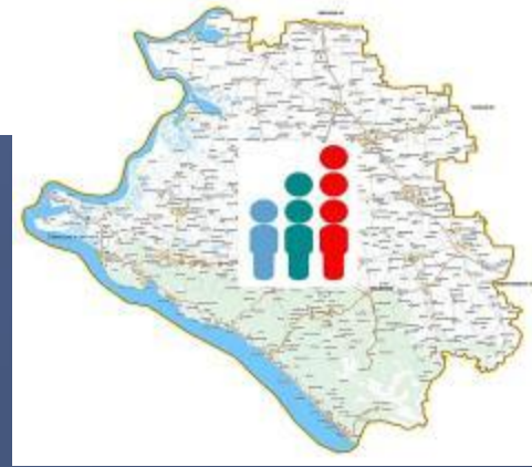
Численность населения Краснодарского края