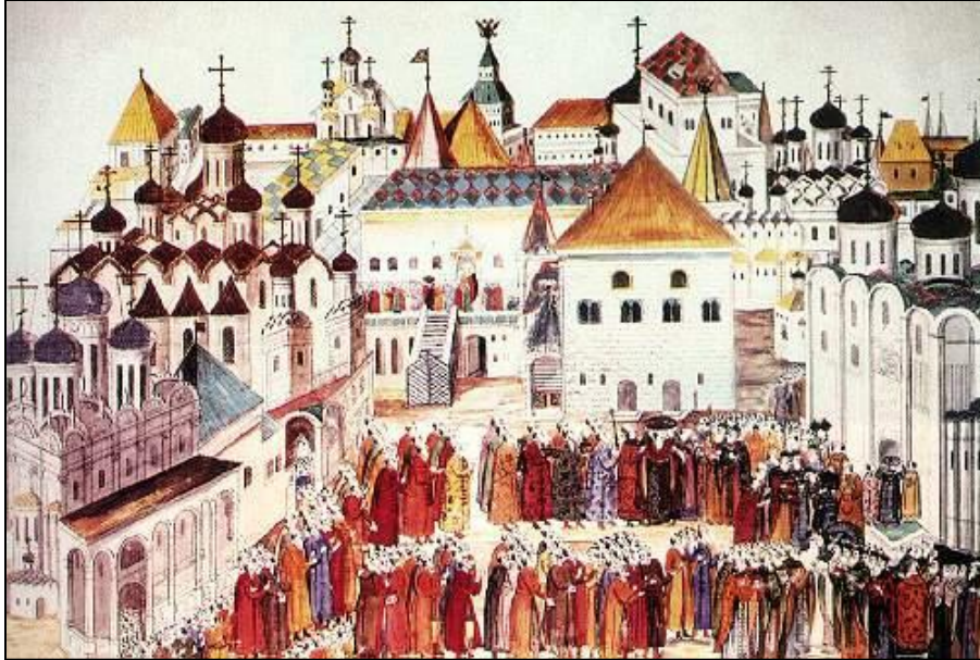
Встреча Лжедмитрия москвичами

18 июля он встретился с матерью Дмитрия царевича Марией Ногой, которая признала в нем своего сына.