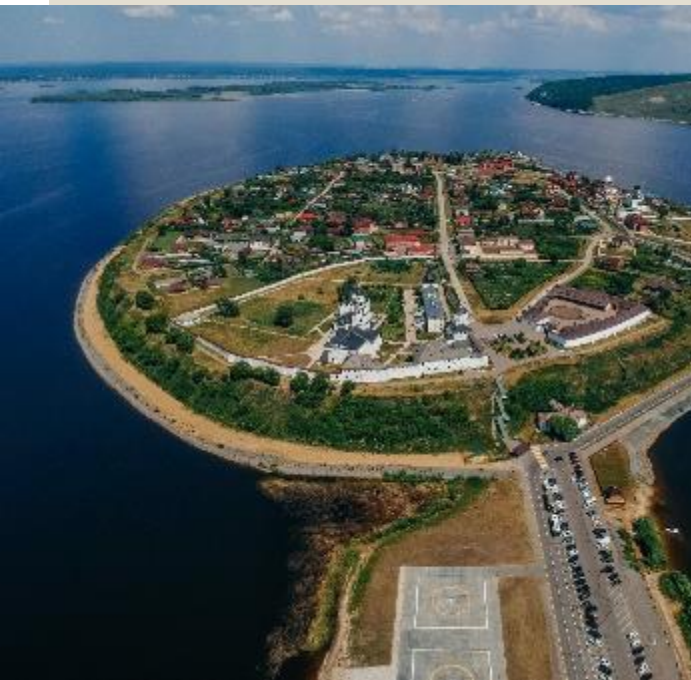
Свияжск, на р.Волге