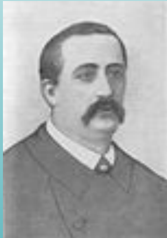
А. П. Бородин