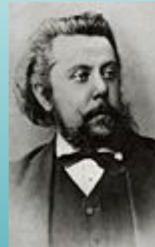
М. П. Мусоргский