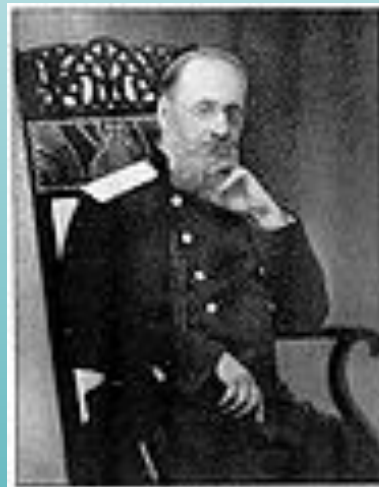
Ц. А. Кюи