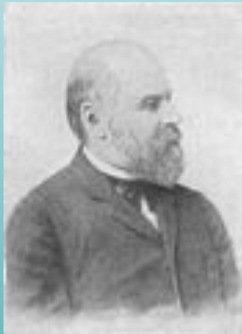
М. А. Балакирев

К середине 1870-х годов «Могучая кучка» как сплочённая группа перестала существовать. Деятельность «Могучей кучки» стала эпохой в развитии русского и мирового музыкального искусства.