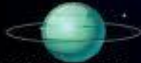
TEN'NŌSEI 天王星 URANO