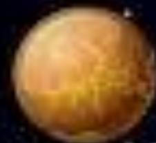
SUISEI 水星 MERCURIO