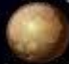
MEIŌSEI 冥王星 PLUTÃO