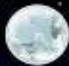
TSUKI 月 LUN