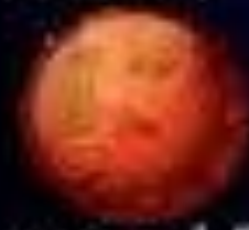
KASEI 火星 MARS