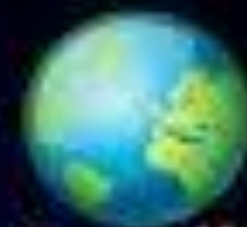
CHIKYŪ 地球 TERRA