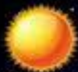
TAIYŌ 太陽 SOL