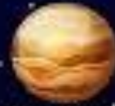
MOKUSEI 木星 JUPITER