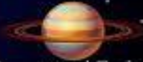
DOSEI 土星 SATURNO