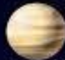
KINSEI 金星 VENUS