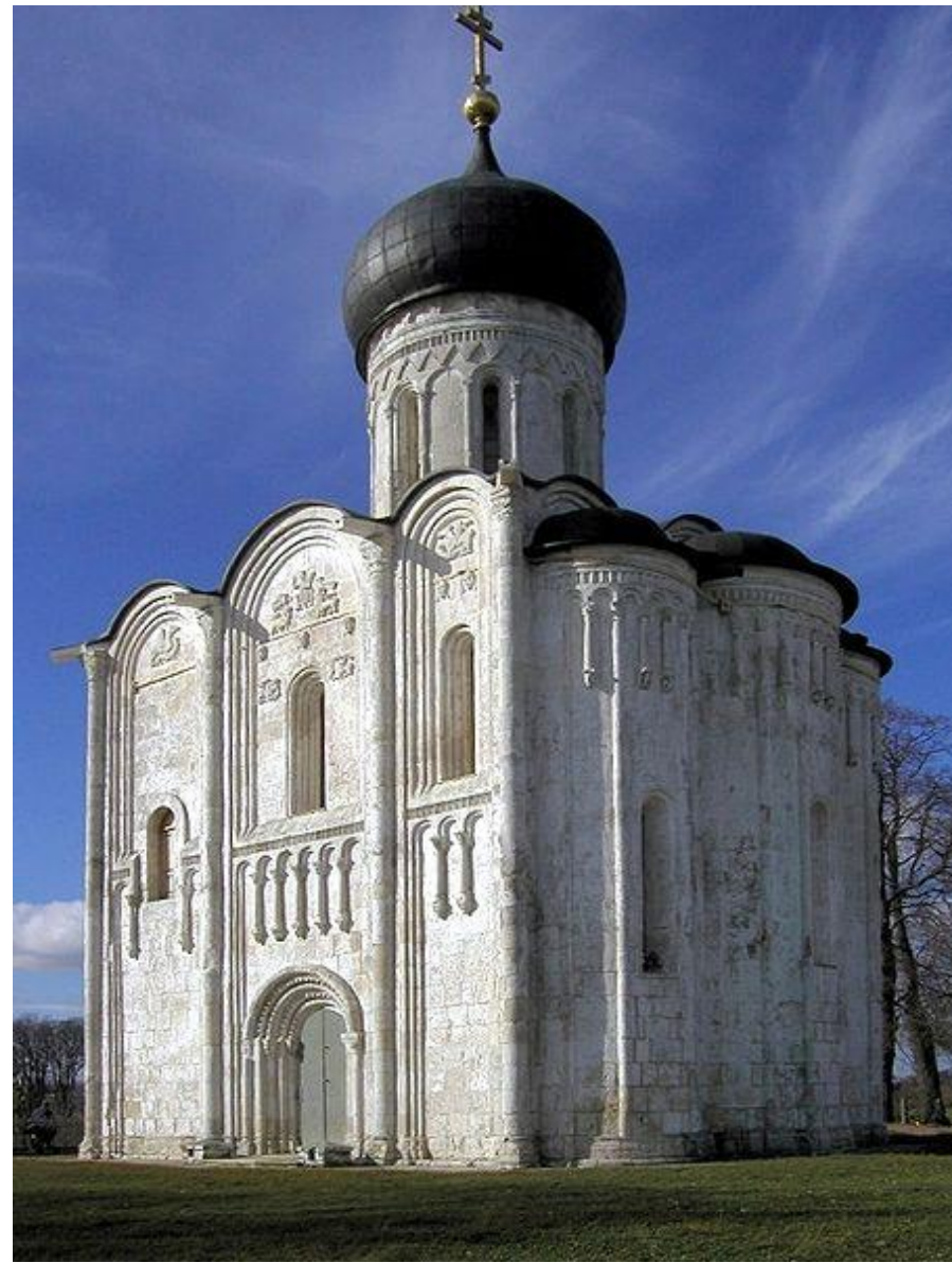
Покрова Богородицы на Нерли. 1165 г.

Храм Покрова Богородицы на Нерли - гордость русского зодчества, гимн красоте и гармонии человека и природы.