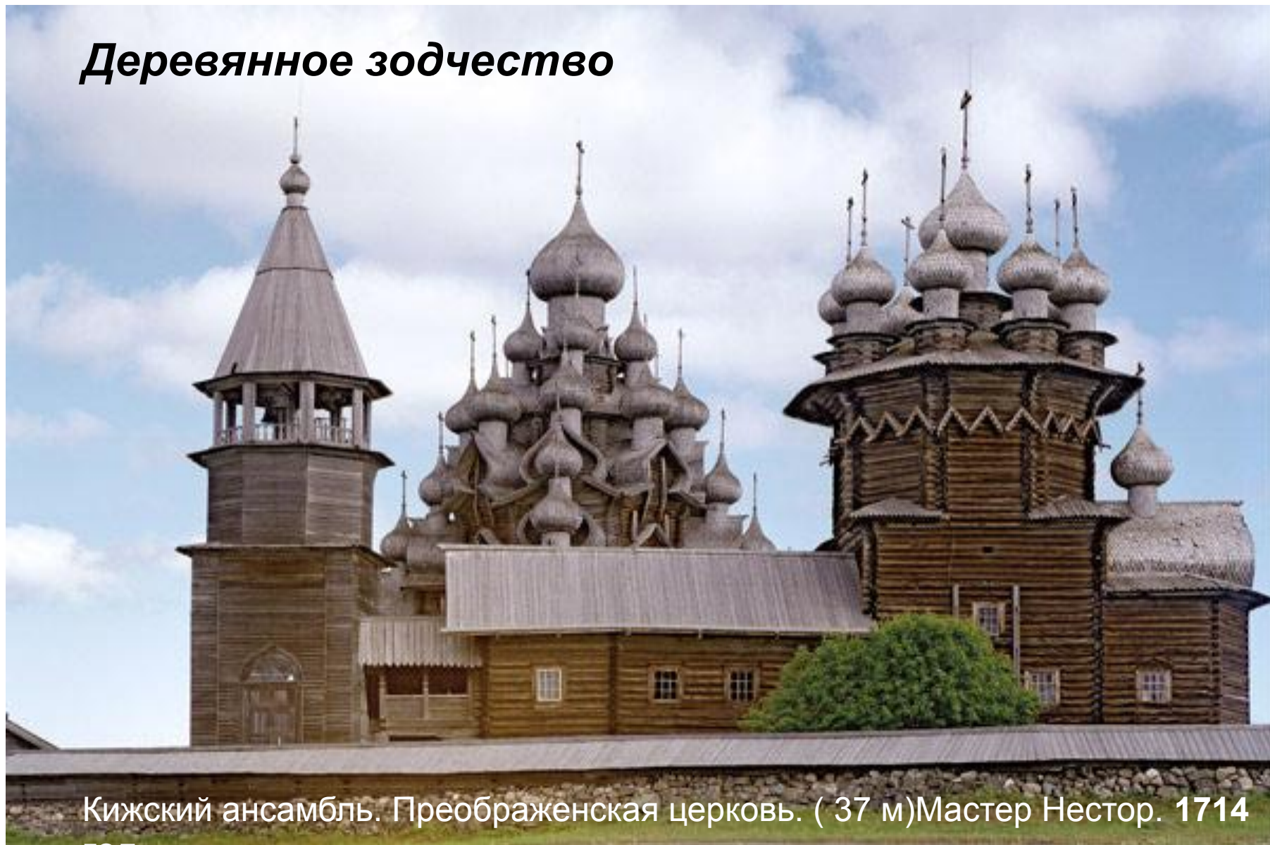
Кижский ансамбль. Преображенская церковь. ( 37 м)Мастер Нестор. 1714