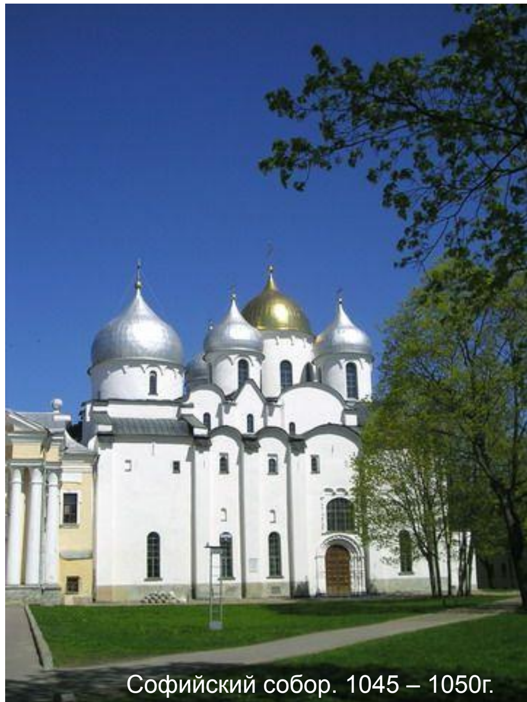
Софийский собор. 1045 – 1050г.

На кресте центрального купола храма сидит голубь. По преданию, Новгород умрет в тот день, когда птица упадет. За всю многовековую историю это случилось лишь однажды –