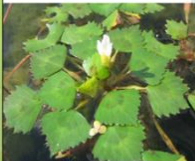
Водяной орех - Trapa natans