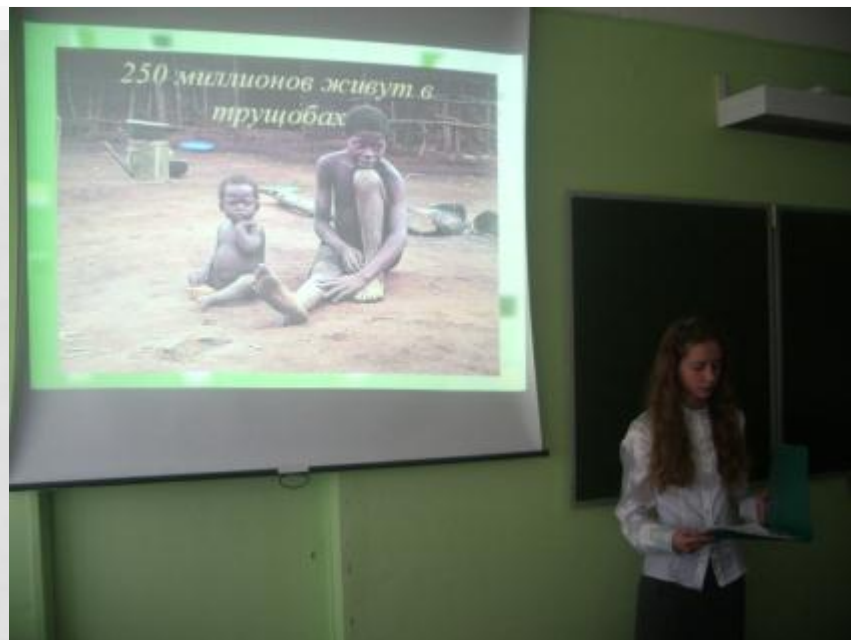
Конференция «Глобальные проблемы человечества»