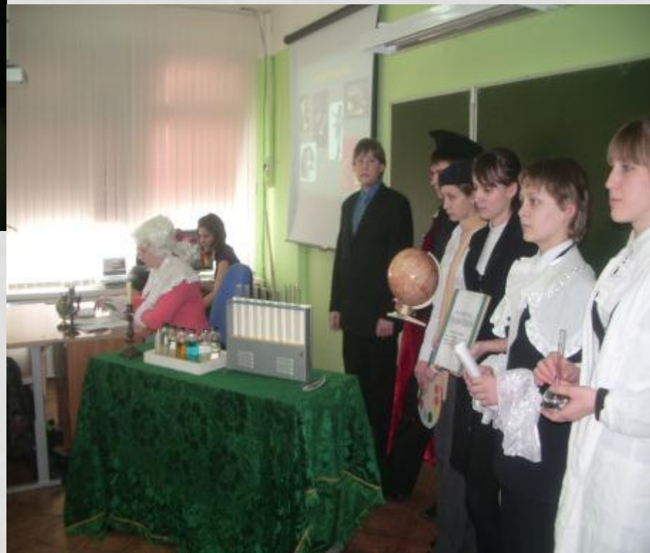
Конференция «300 лет со дня рождения М.В. Ломоносова»