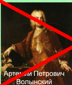
Арте́ми Петро́вич Вольны́й