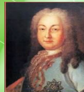
А. И. Остерман – вице-канцлер, президент Коммерц-коллегии