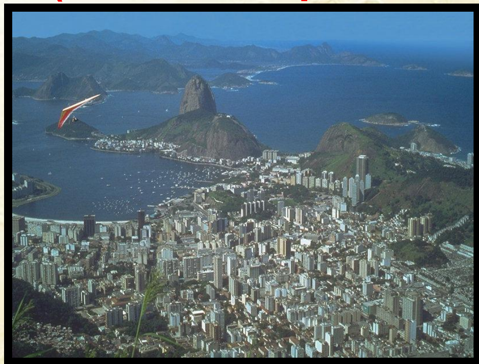
ПРИ морский (город)