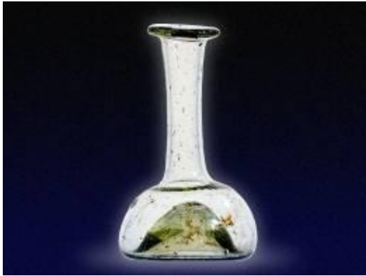
Флакони для парфумів, XII ст.