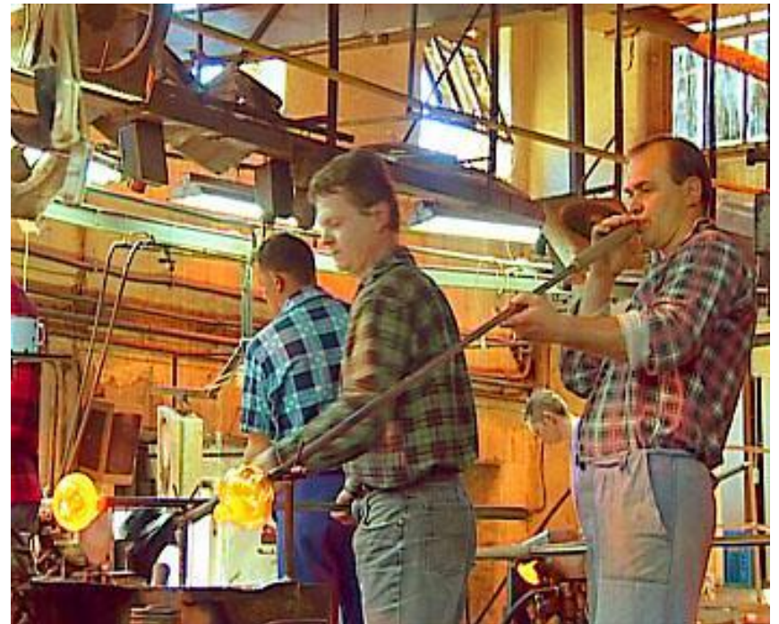
Вироби складної форми видувають вручну