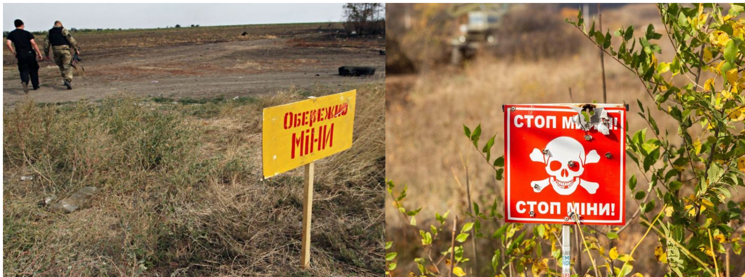
Неофіційні попереджувальні знаки

Неофіційні попереджувальні знаки. Їх установлюють із підручних матеріалів і предметів. Це можуть бути знаки «Небезпечно — міни!», написані фарбою на фанері, паркані, стіні, а також прикріплені яскраві стрічки, які привертають увагу людей.