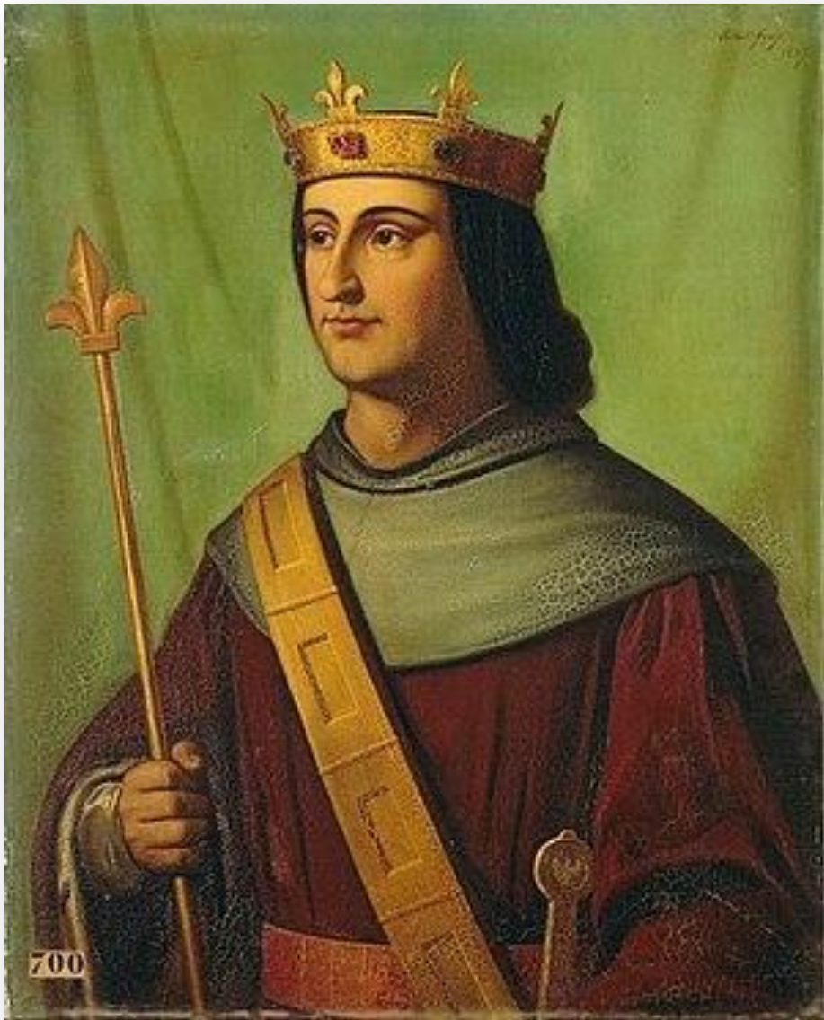
Філіп VI Валуа (1328–1350)