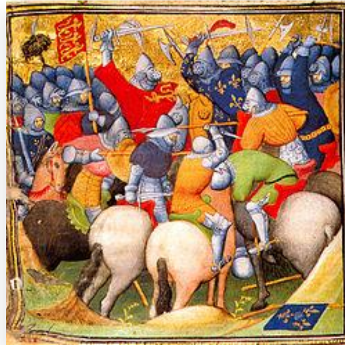
Битва при Кресі (1346)