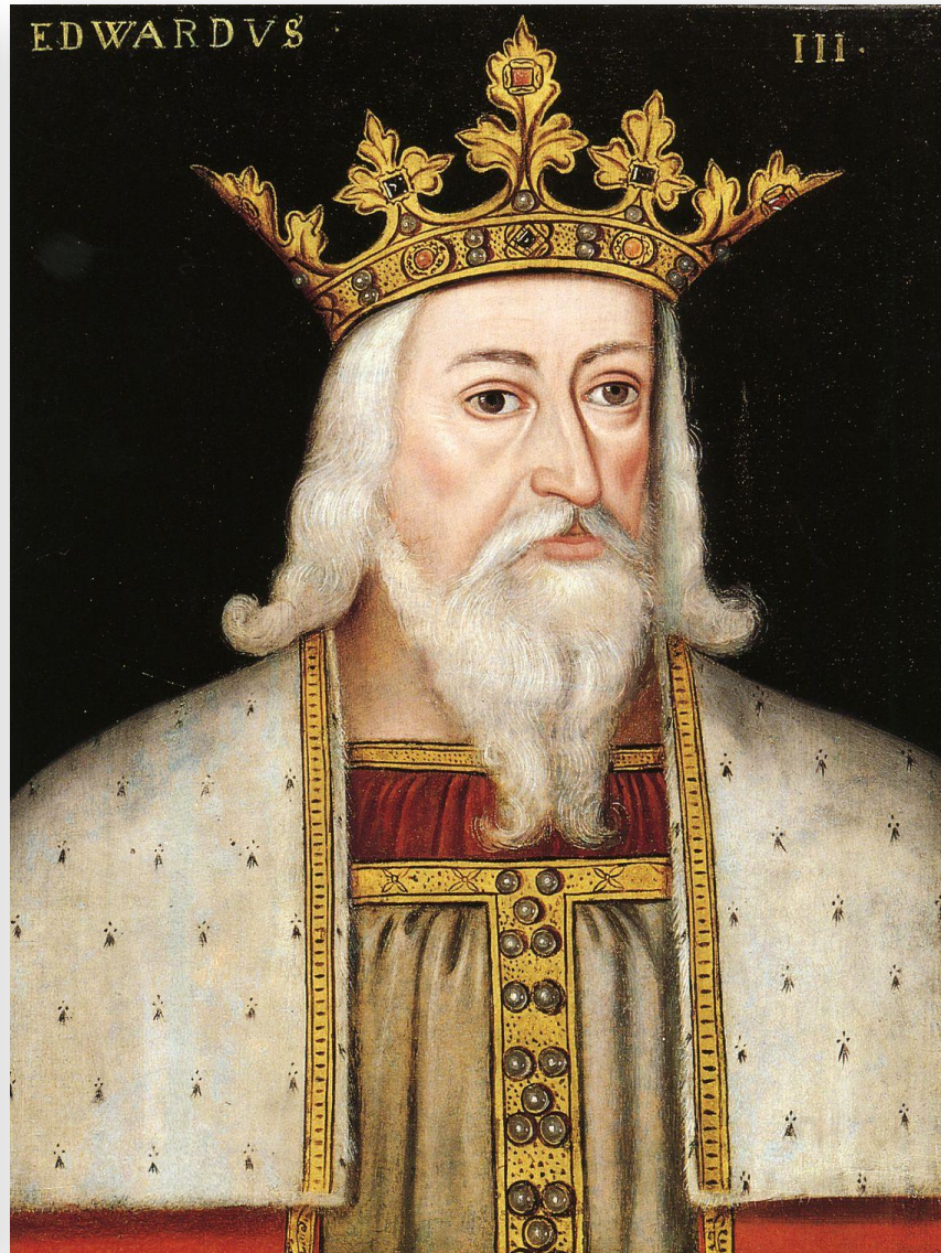
Едуард III (1327–1377)