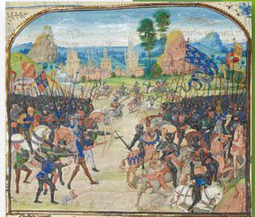
Битва при Пуатьє (1356)

«Якби риби вміли говорити, вони б розмовляли французькою».