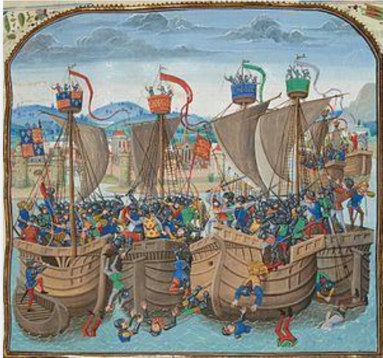
Битва при Слейсе (1340)