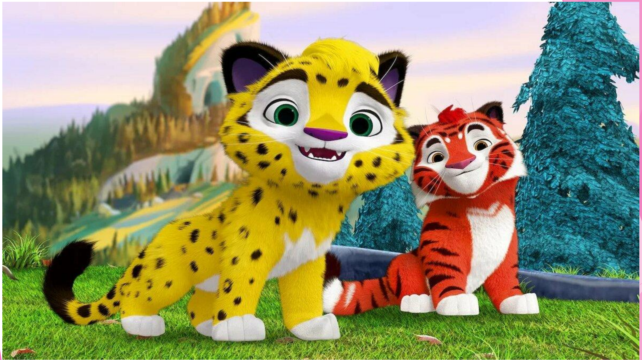
«Лео и Тиг»