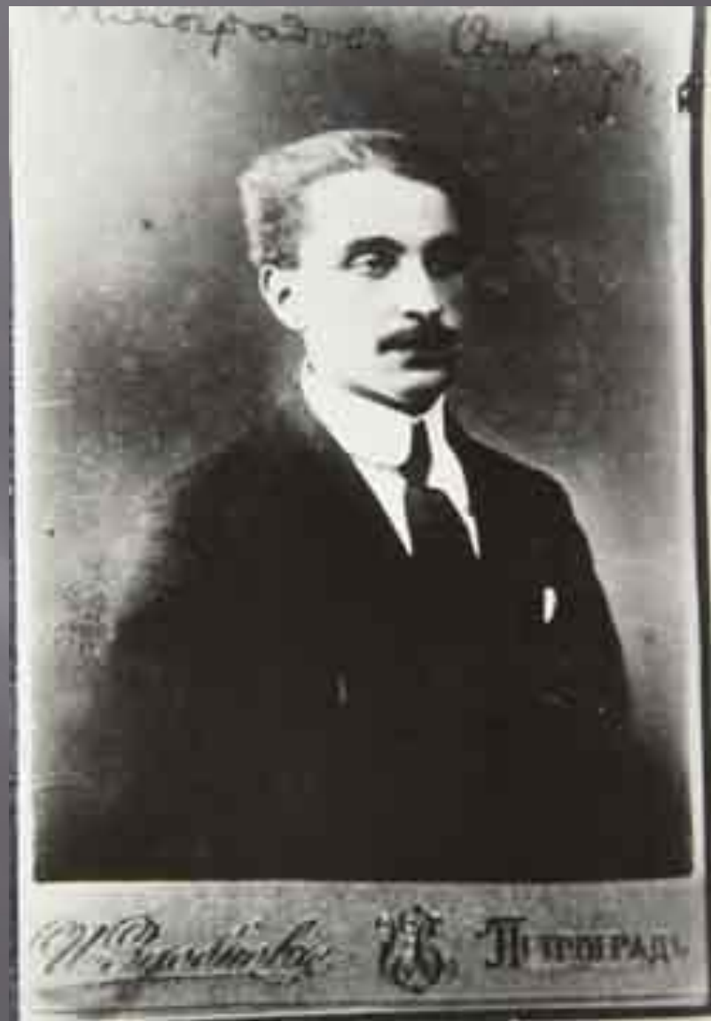
Фотография В.В.Виноградова университетского времени

Среднее образование Виктор Владимирович получил в Рязанской духовной семинарии. В 1917 году Виноградов одновременно окончил историко-филологический факультет Петроградского университета. По предложению А.А.Шахматова, выдающегося русского филолога, Виноградов остается при историко-филологическом факультете Петроградского университета для подготовки к профессорскому званию.