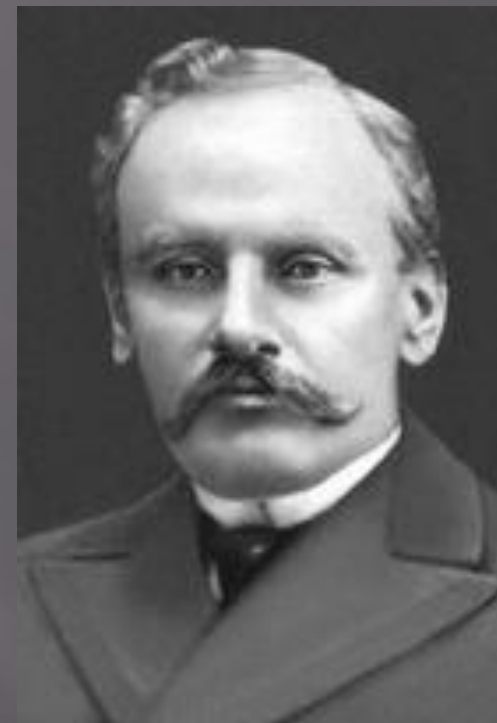
Шахматов А. А.

Достаточно рано Виноградов активно выступает и как ЛИНГВИСТ ; он стал одним из последних учеников А. А. Шахматова (работа о фонеме ять в северных говорах). До 1929 работал в Петербурге (Петрограде, Ленин граде), где учился у Л. В. Щербы , но затем переехал в Москву и создал собственную лингвистическую школу (виноградовскую школу русистики).