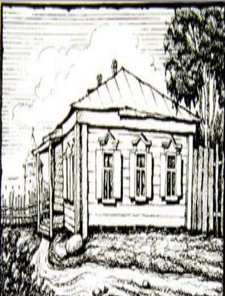
Дом в Зарайске, где родился В.В.Виноградов