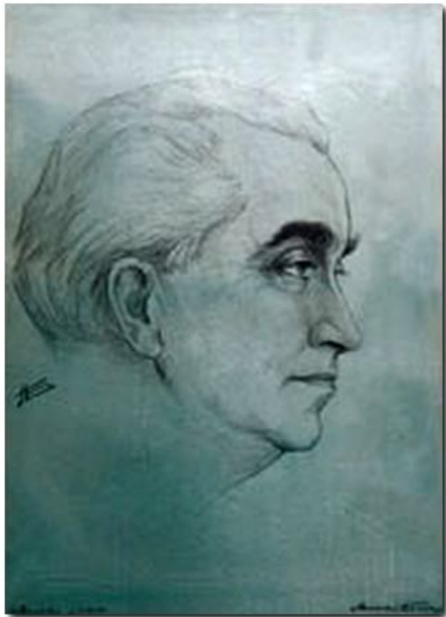
Портрет. Худ. А. Балагур. 1967. Бумага, цветные карандаши.