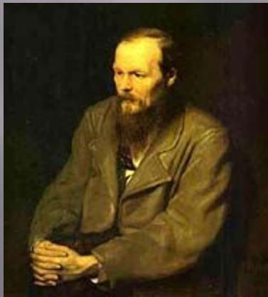
Достоевский Ф. М.