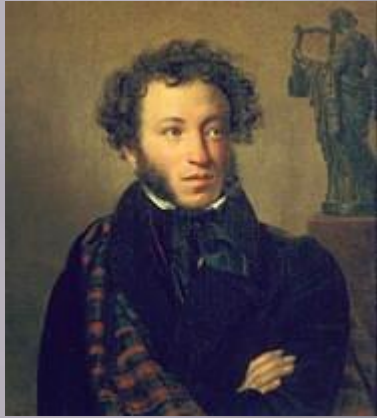
Пушкин А. С.

Получил первую известность благодаря литературоведческим публикациям (о стиле писателей-классиков и современников: А. С. Пушкина , Н. В. Гоголя , Ф. М. Достоевского , Н. С. Лескова и др.; выступал также с чисто историко-литературными работами, публикациями неизданных произведений и т. п.). Свой метод определял как историко-литературный. Считал необходимым особое исследование языка и стиля писателя. При этом он скептически относился к господствующему в 1920-е годы классово-социологическому подходу. Всю жизнь не терял интереса к литературоведению, особенно к изучению индивидуального стиля писателей (руководил составлением «Словаря языка Пушкина» в 1950-е ) и к сравнительным историко-литературным исследованиям.