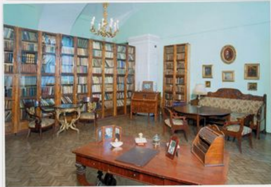
Мемориальный кабинет академика В. В. Виноградова в Пушкинском Доме. 2002