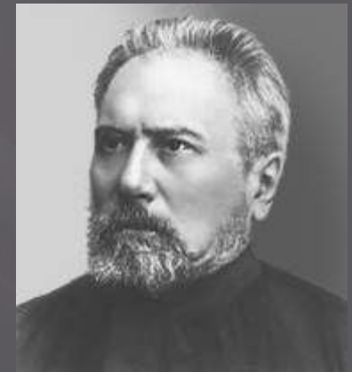
Лесков Н. С.