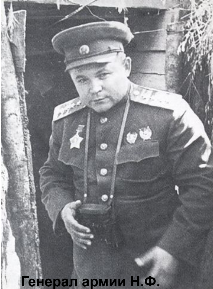
Генерал армии Н.Ф. Ватутин