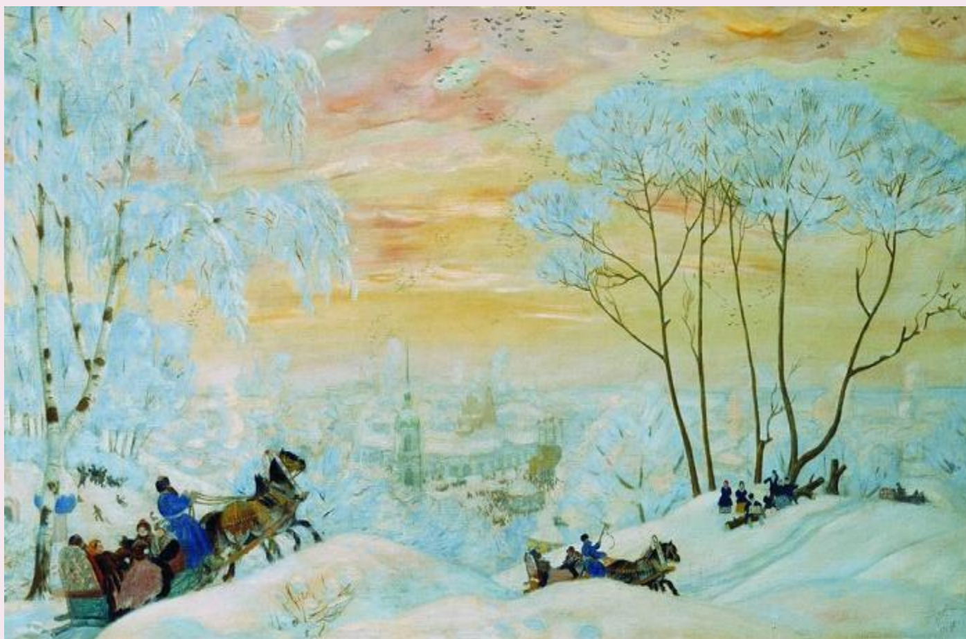
Суббота – ЗОЛОВКИНЫ ПОСИДЕЛКИ Б.М.Кустодиев