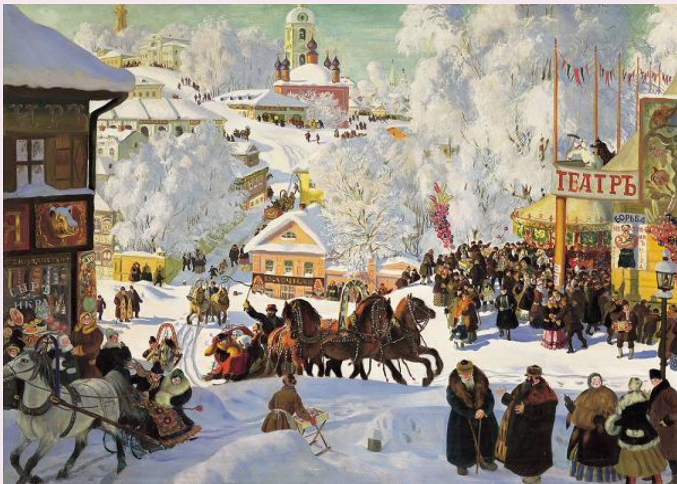
Воскресенье – ПРОЩЁННЫЙ ДЕНЬ Б.М.Кустодиев