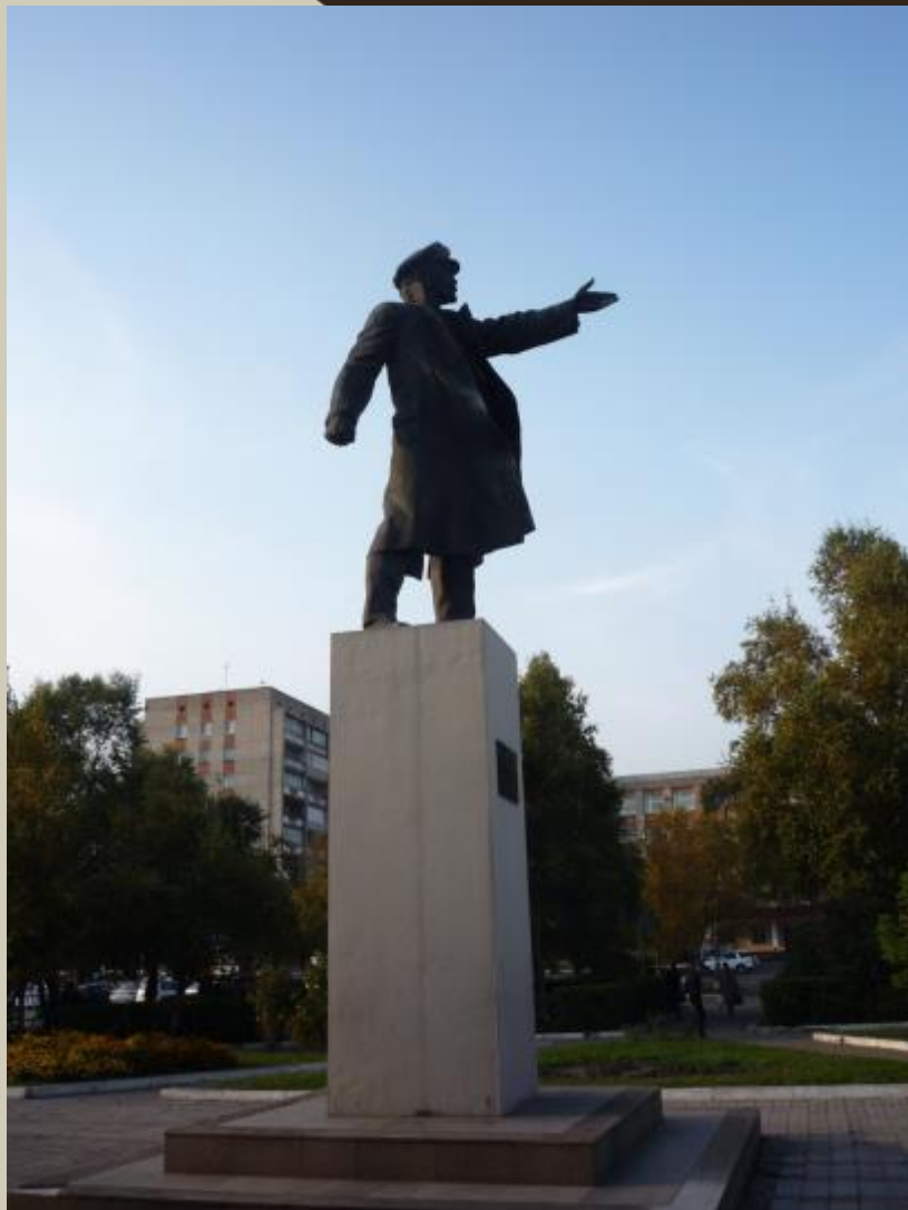
Памятник В. И. Ленину