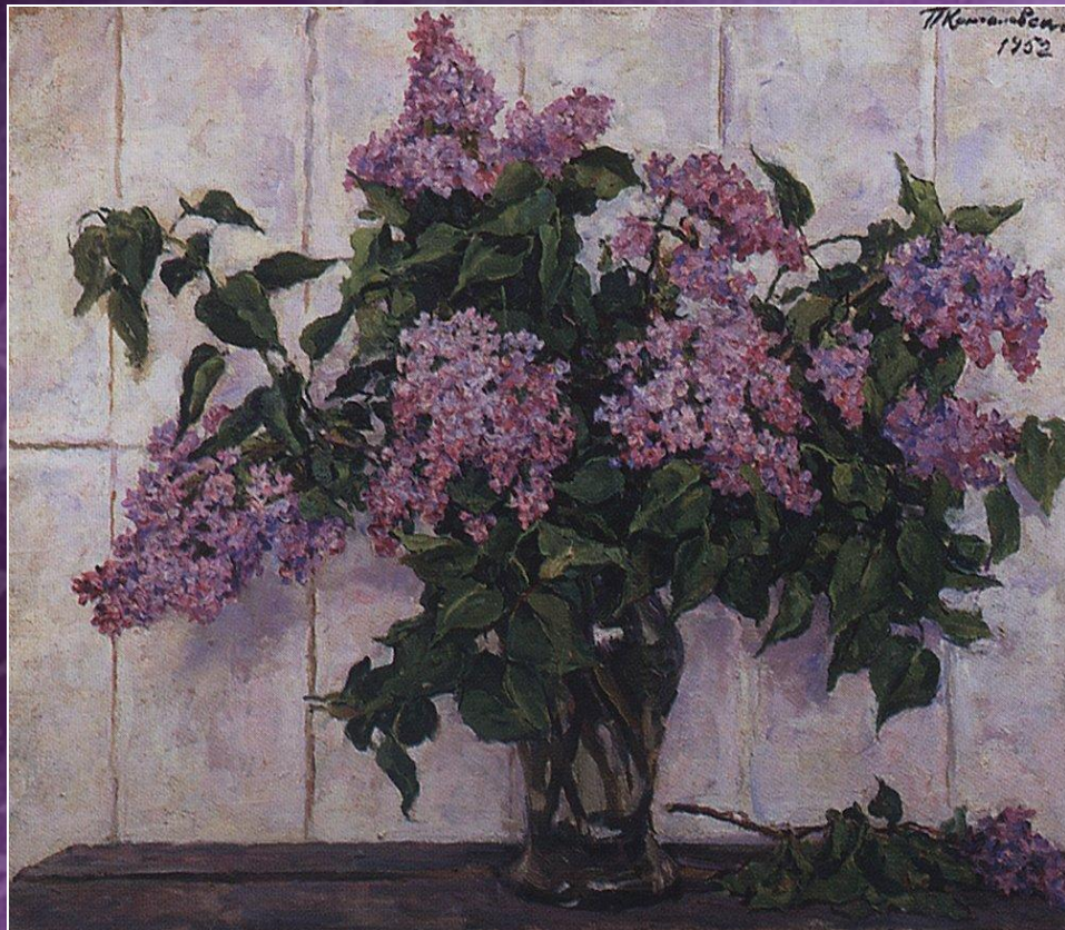
Сирень в стеклянной банке 1952