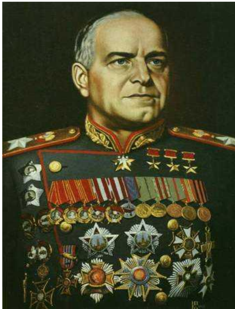
Маршал Советского Союза Г.К. Жуков