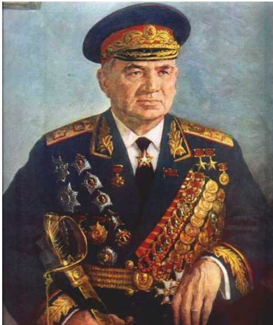
Маршал Советского Союза В.И.Чуйков