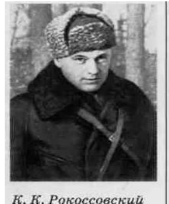
К. К. Рокоссовский