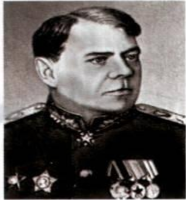
А. М. Василевский

Маршал, зам. начальника Генштаба во время В.О.В. Руководитель ряда операций. Ф.Рузвельт. Президент США.