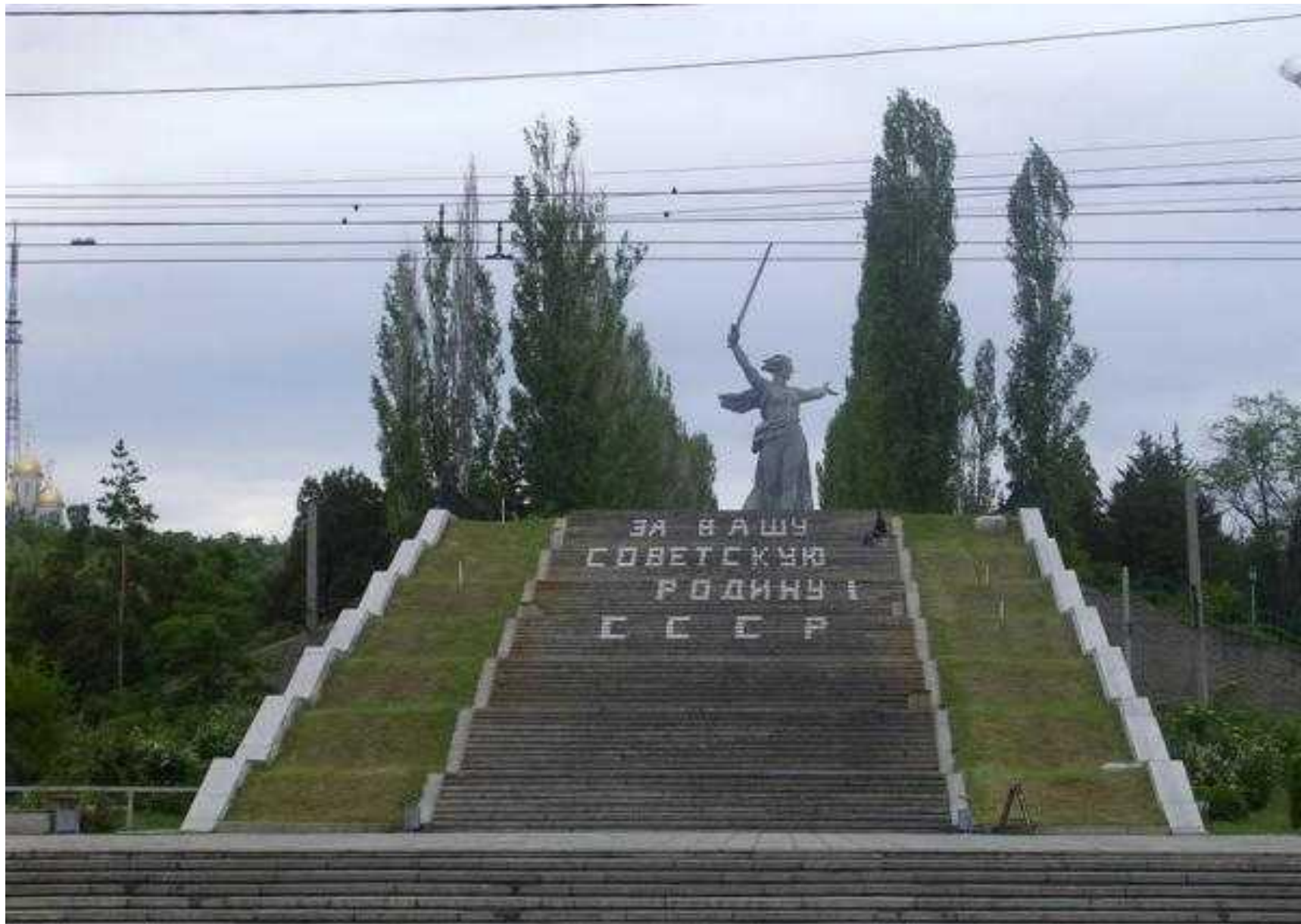
Лестница на Мамаев курган