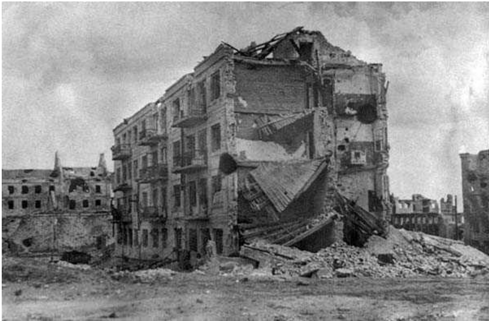
Дом Павлова в Сталинграде