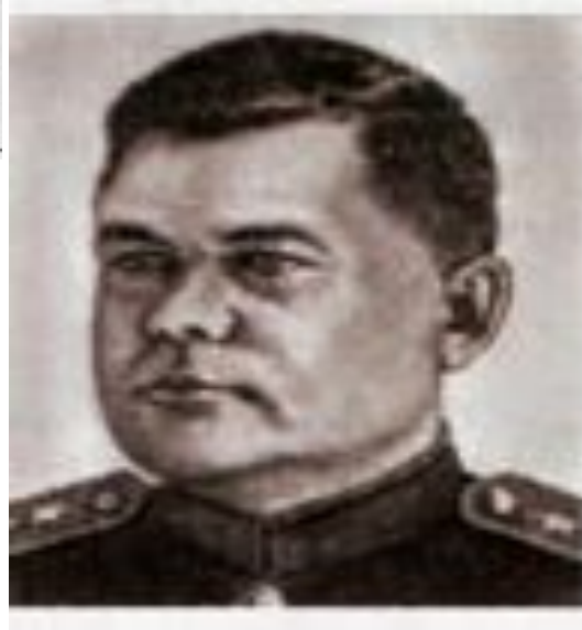
Ген. Ватутин – ком. Юго-Западным фронтом