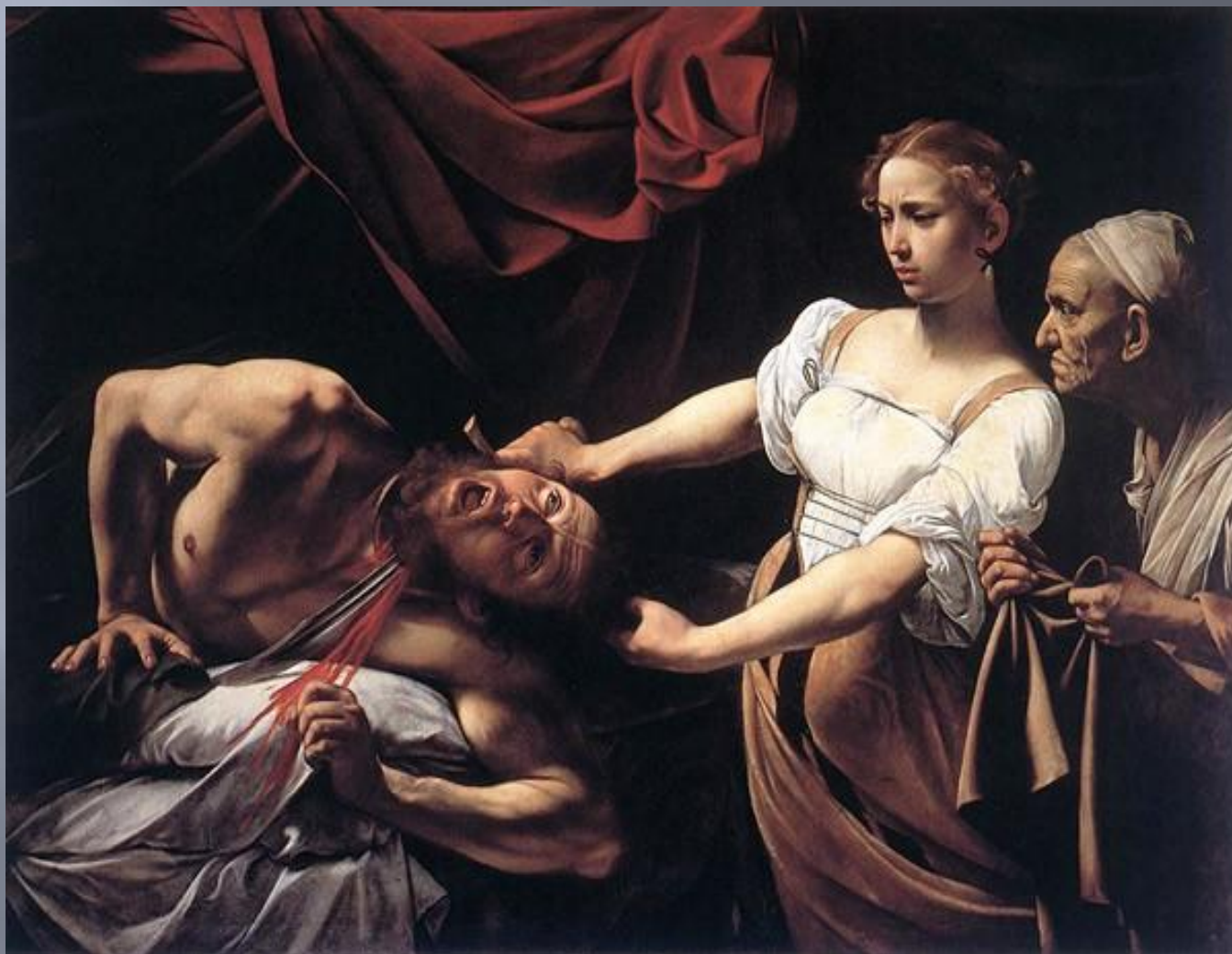
Юдифь и Олоферн