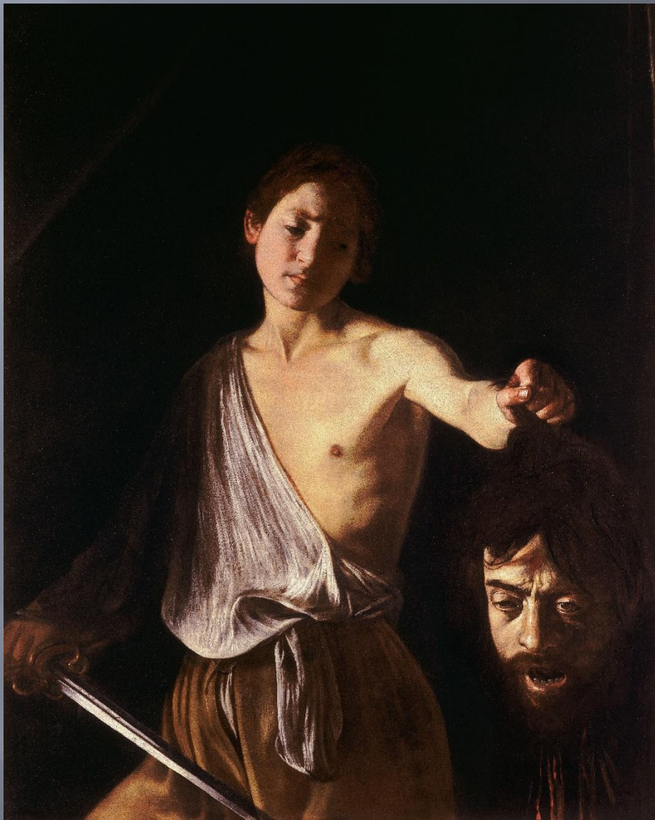
Давид с головой Голиафа