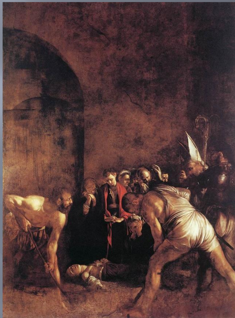
Погребение Св. Лучии