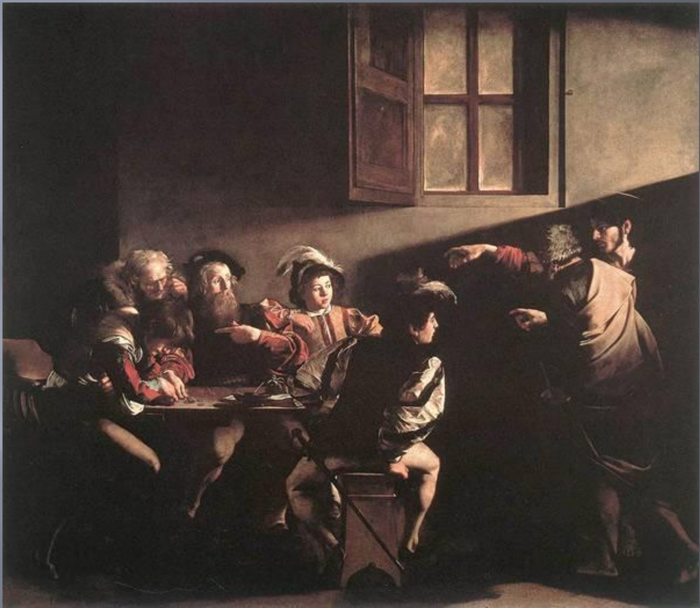
Призвание святого Матфея