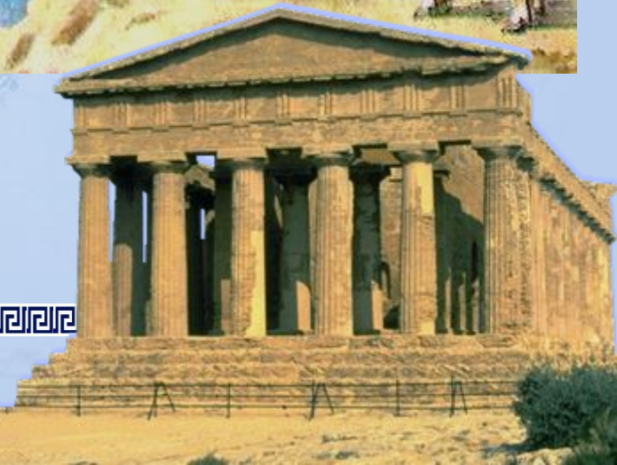
Храм Геры на о.Сицилия

греки укрепляли свои поселения крепостными стенами, опасаясь внешних врагов