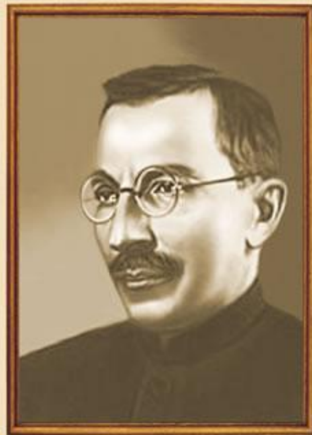
Макаренко Антон Семенович (1888-1939)

«Лежит младенец и дрыгает ножками, а вырастает из него подхалим, пошляк, враль, подлец и преступник».