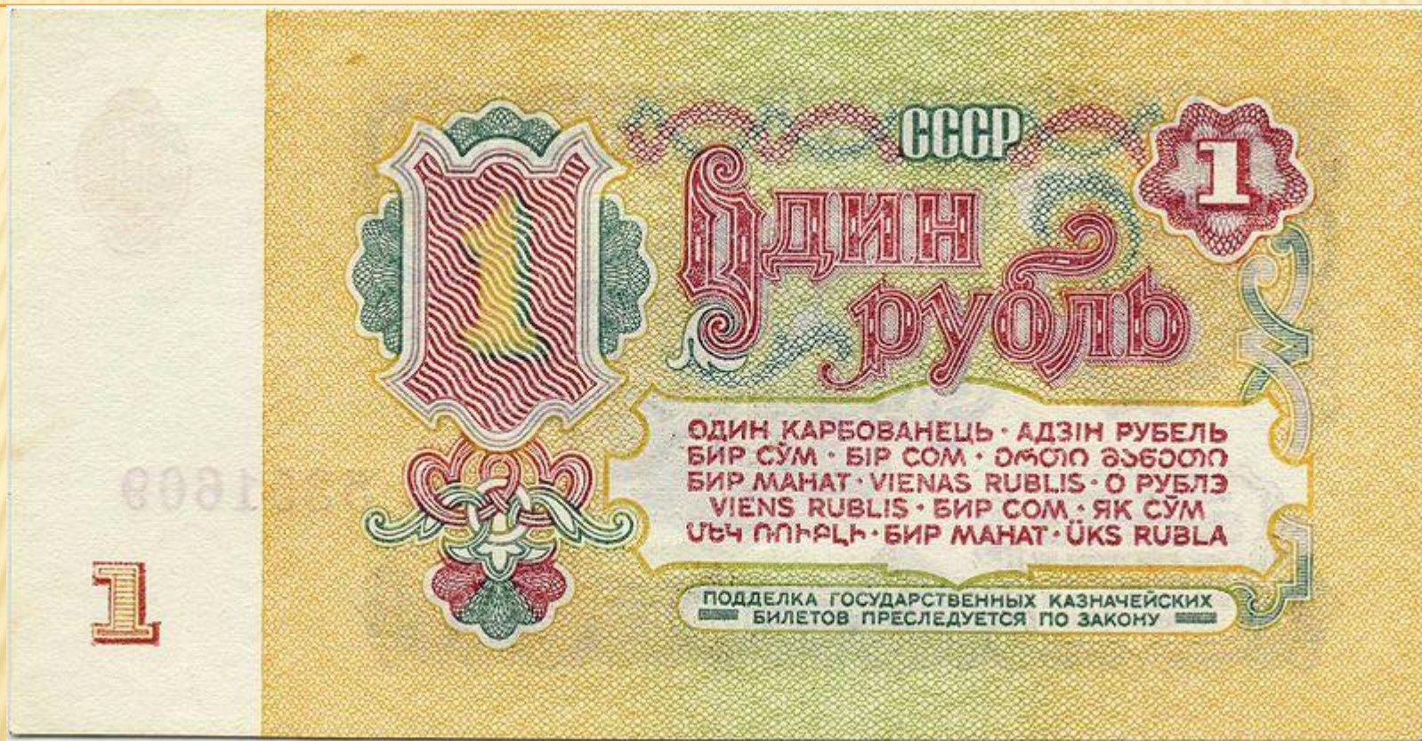
Післяреформенний рубль 1961 року