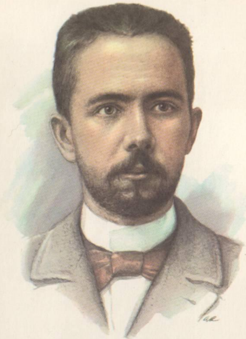
ВАСИЛИЯ СЕРГЕЕВИЧ КАЛИННИКОВ

Лишь через два года она была исполнена в Киеве и получила полное признание.