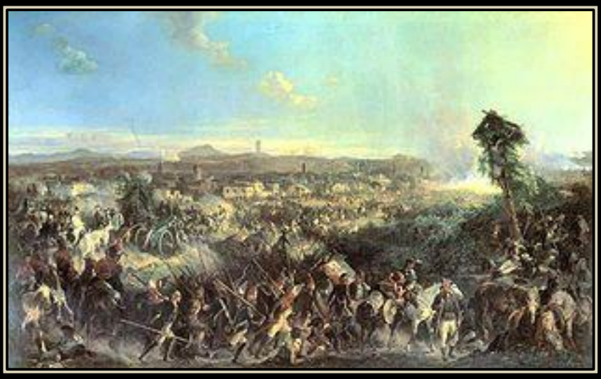
«Сражение при Нови». Художник А. Коцебу