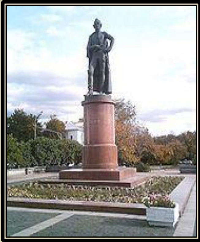
Памятник Суворову в Москве