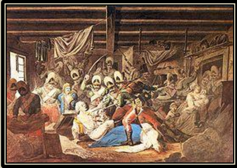
«Резня в Праге». Взгляд на события с польской стороны.