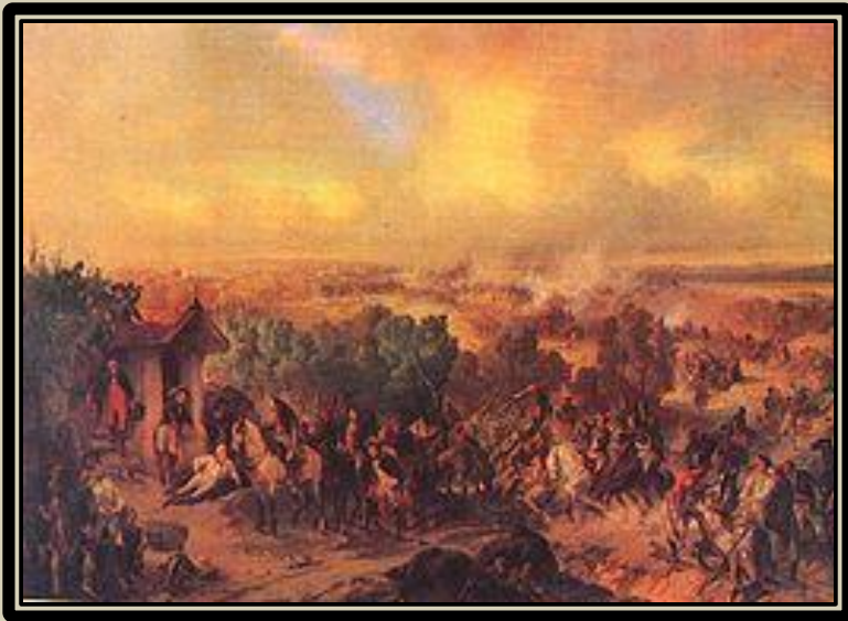
«Битва при Треббиа». Художник А. Коцебу.