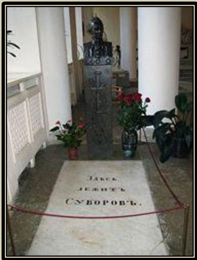
Могила Суворова в Александро-Невской лавре.

«О вечность! прекрати твоих шум вечных споров Кто превосходней всех героев в свете был. В святилище твое от нас в сей день вступил, Суворов».