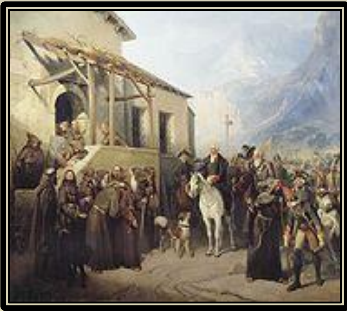
«Фельдмаршал Суворов на вершине Сен-Готарда 13 сентября 1799 года»