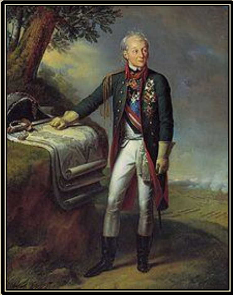
«Портрет А. В. Суворова». Художник К.Штейбен

Суворов назначается командиром бригады из Смоленского, Суздальского и Нижегородского мушкетёрских полков 15(26) мая 1769 г., и направляется в Польшу для участия в военных действиях против войск шляхетской Барской конфедерации. Первая польская кампания также стала первым боевым применением опыта, полученного в Семилетней войне. 2 сентября 1769 г он одерживает победу над конфедератами у деревни Орехово. Суворов одерживает победы при Ландскруне (разгромив знаменитого французского генерала Ш.-Ф.-Дюмурье) и при Замостье. Наиболее выдающейся в этой кампании стала победа Суворова с отрядом из 900 человек над корпусом гетмана Огинского (5 тысяч человек) в деле при Столовичах 13 сентября 1771 г. Последним достижением Суворова в первой польской кампании стало взятие Краковского замка.