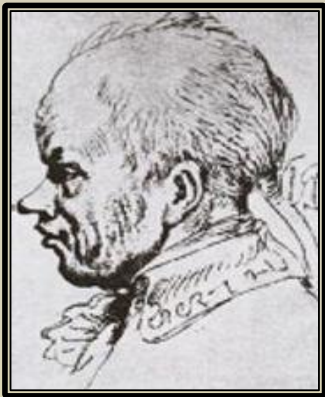
Набросок (карикатурный) головы Суворова, сделанный с натуры в 1795г. Графиком Яном Норблином.