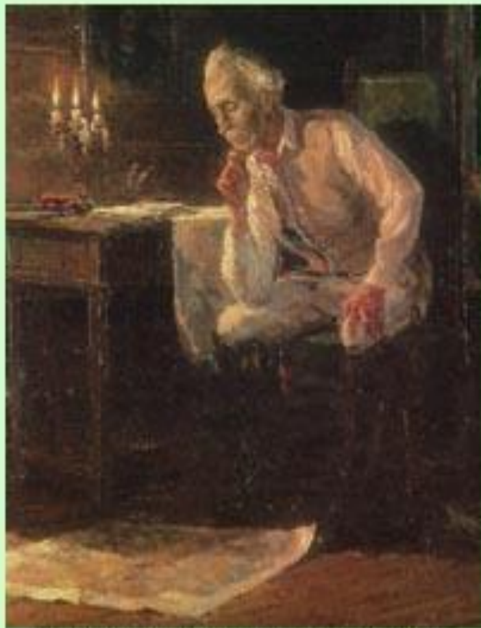
"А.В.Суворов в селе Кончанском". Художник Л.Вашля.

В 1774г.в августе Суворов был направлен для участия в подавлении Крестьянской войны под предводительством Пугачева. В августе 1782 года вновь направлен на Кубань для подавления ногайского восстания. Около крепости Кременчик Суворов полностью разбил ногайские войска, вследствие чего большинство татарских мурз выразили покорность Суворову и признали присоединение Крыма и ногайских земель к России.