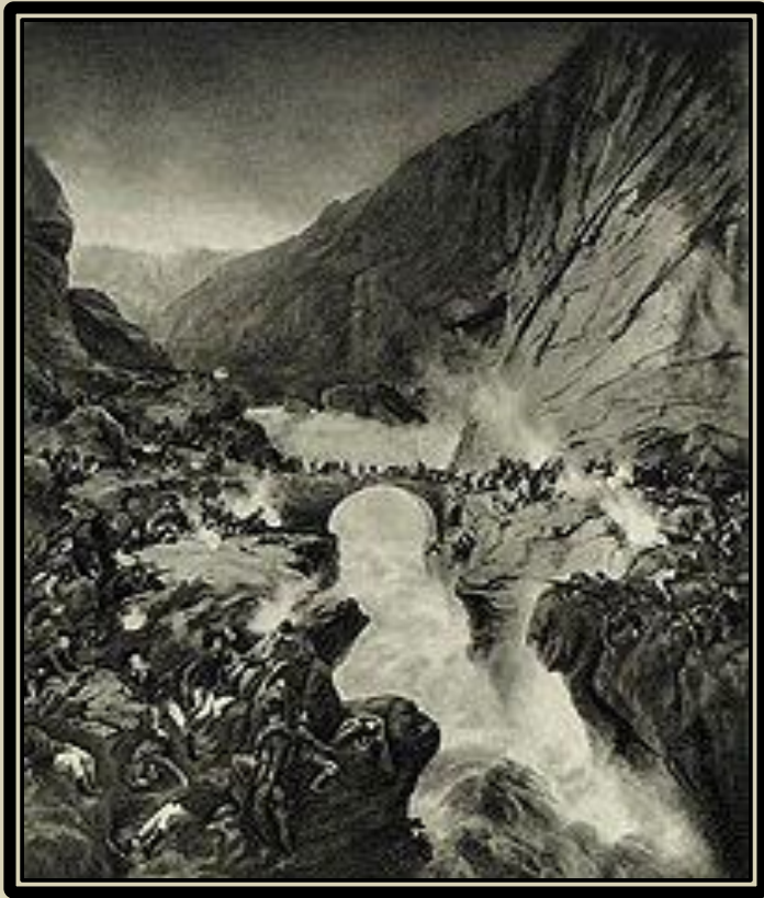
«Переход Суворова через Чёртов мост». Художник А. Коцебу.