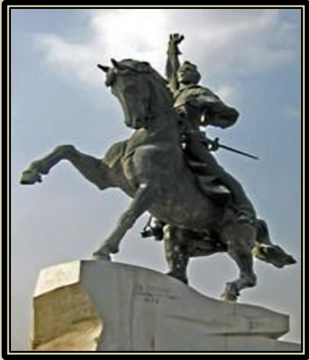
Конный памятник Суворову в городе Тирасполе.