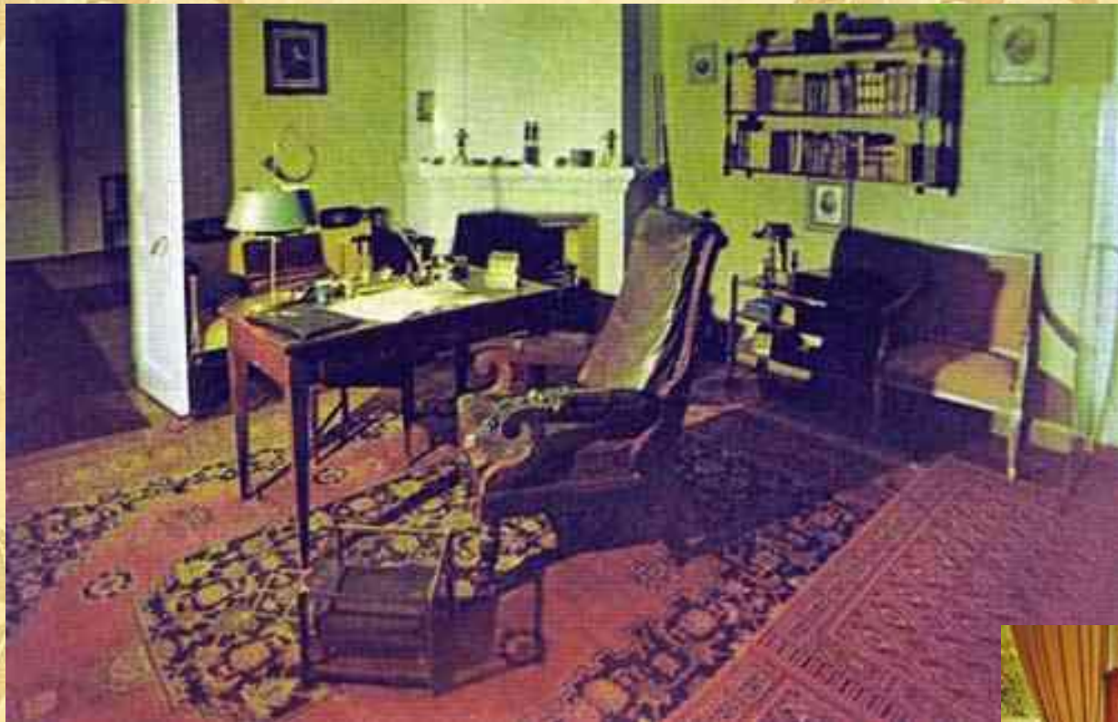
Кабинет Пушкина А.С.