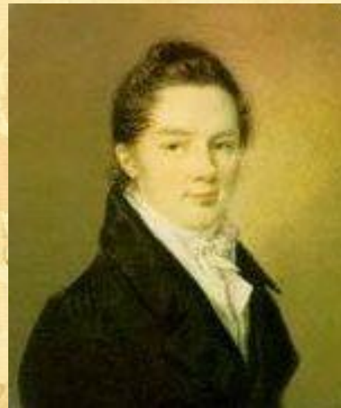
Иван Иванович Пуцин

Пушкин сохранил лицейскую дружбу и культ Лицея на всю жизнь.