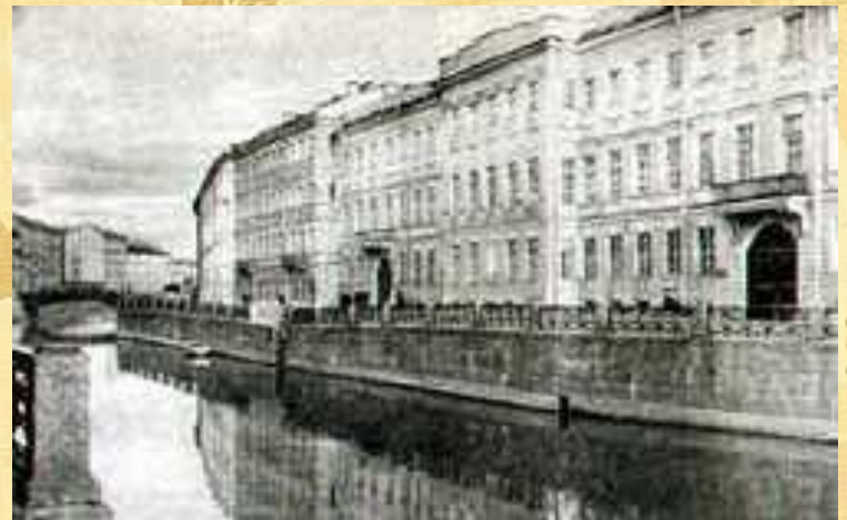
Квартира Пушкина в Петербурге на Набережной Мойки

С середины октября 1831 г. и уже до конца жизни Пушкин с семьей живет в Петербурге.