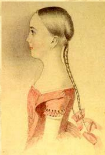
Старшая дочь, Мария Александровна Пушкина (1832-1919г.)