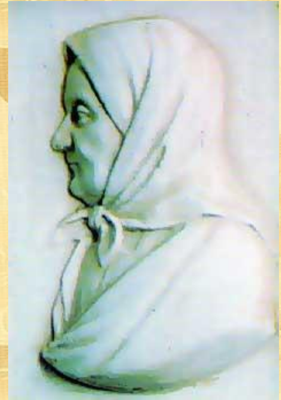
Яковлева Арина Родионовна

Любовь к родному языку маленькому Пушкину привили бабушка - Мария Алексеевна Ганнибал, превосходно говорившая и писавшая по-русски, и няня Арина Родионовна.