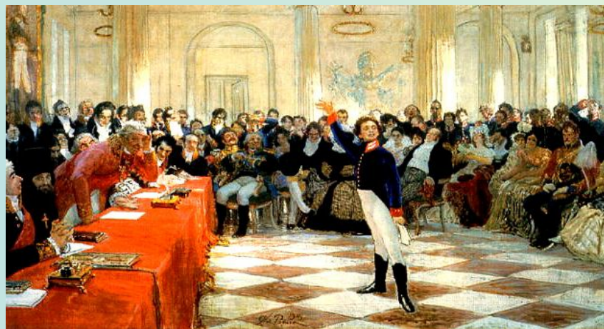
Илья Репин. 1911 г.

Где б ни был я: в огне ли смертной битвы, При мирных ли берегах родимого ручья, Святому братству верен я.