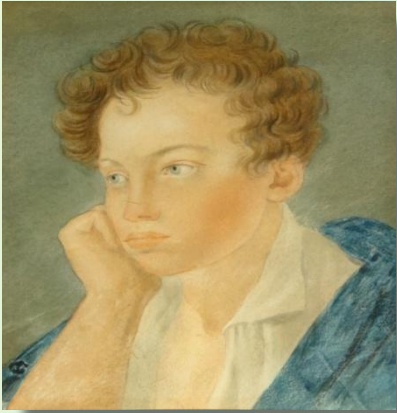
Портрет Пушкина Акварель С. Г. Чирикова, 1810

Пушкин в возрасте 12 лет выдерживает вступительные экзамены и в числе 30 мальчиков зачисляется в Царскосельский Лицей. Занятия в Лицее проходили по-разному. Пушкин не любил математику, поэтому часто можно было наблюдать такую картину: