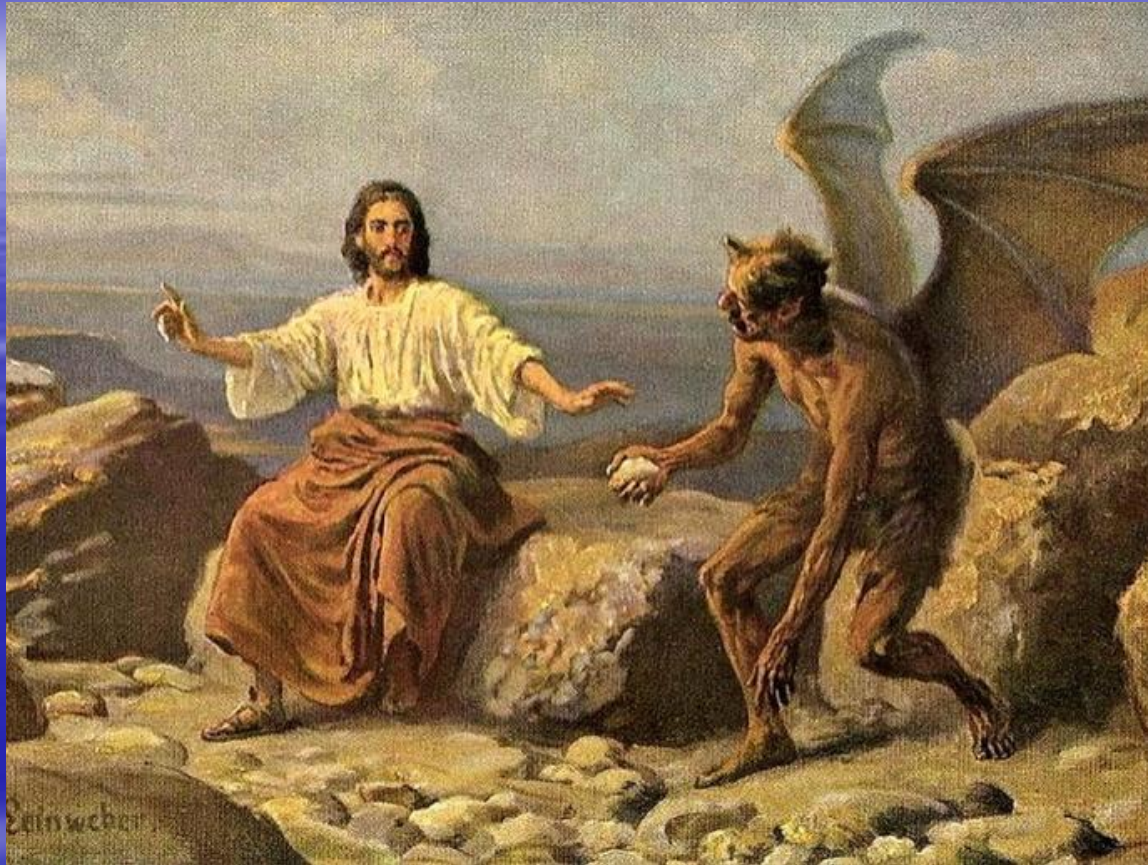
Искушение Христа в пустыне