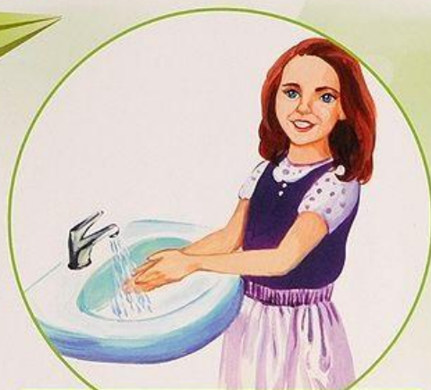
Умываюсь холодной водой