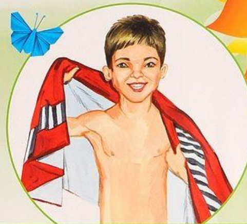
Обтираюсь влажным полотенцем