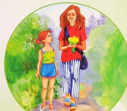
Гуляю на улице