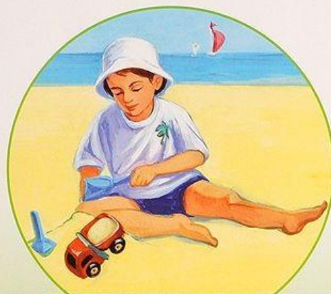
Греюсь на солнышке