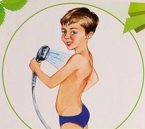
Принимаю контрастный душ

Закаливание дарит нам здоровье и отличное настроение