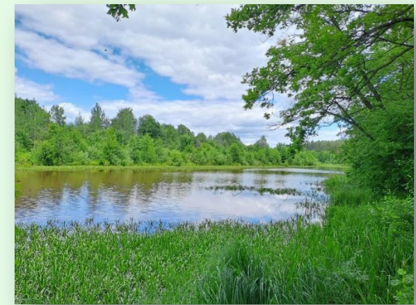
Рахмановская старица, 2023 год.