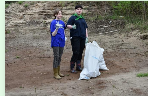
Акция «берег добрых дел», р. Клязьма, 2023 год