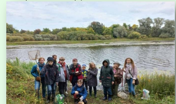
Исследовательский практикум, 2022г