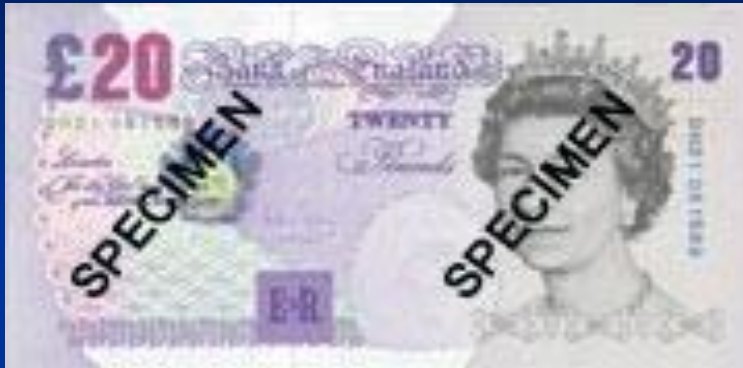
Британский фунт стерлингов