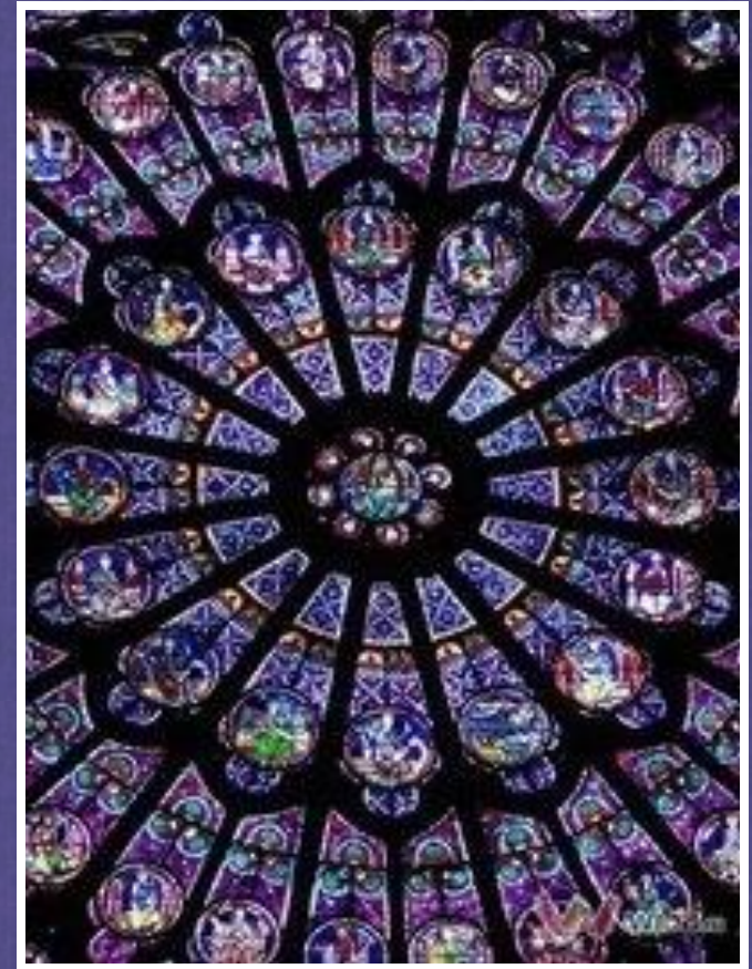
Собор парижской богоматери