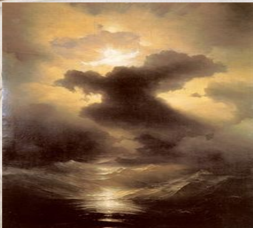
Хаос. Сотворение мира. 1841