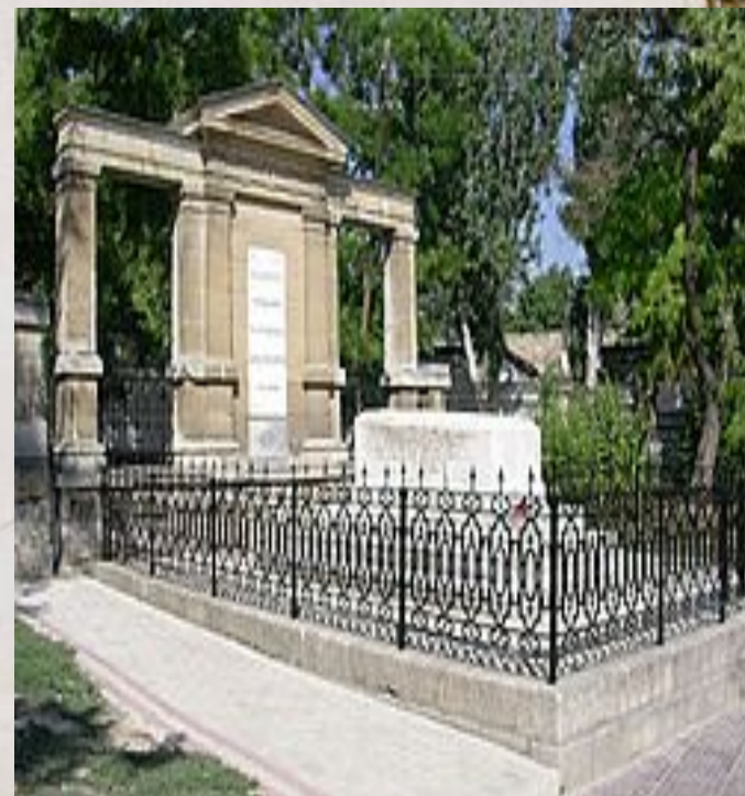
Могила И. К. Айвазовского во дворе армянской церкви Сурб-Саркис в Феодосии.