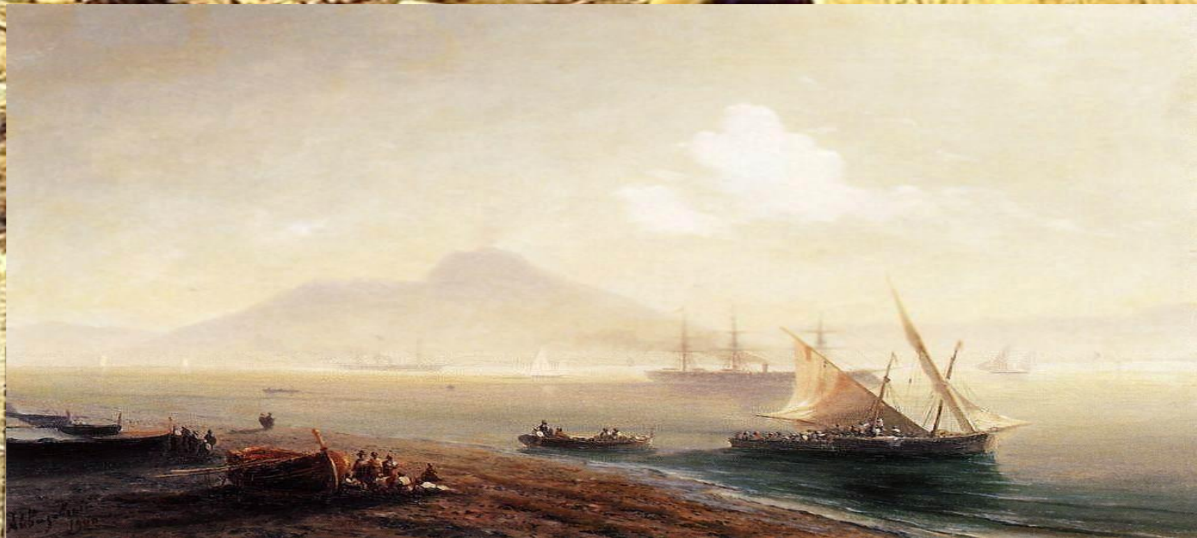
Морской залив, 1900г.

Перед самой смертью Айвазовский написал картину «Морской залив»; а в последний день жизни начал писать картину «Взрыв турецкого корабля», которая осталась незаконченной. В общей сложности за свою жизнь Айвазовский написал больше 6000 картин и устроил порядка 125 персональных выставок в