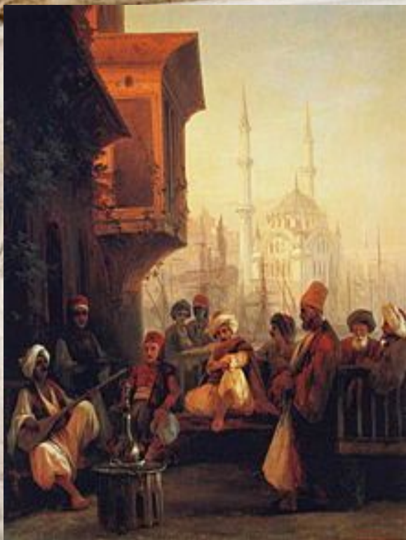
Кофейня у мечети Ортакей в Константинополе, 1846

В 1844 году Айвазовский становится живописцем Главного морского штаба России, а с 1847 — профессором Петербургской Академии художеств