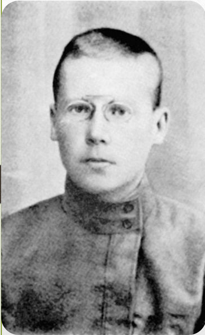
Ленинград. 1921 год