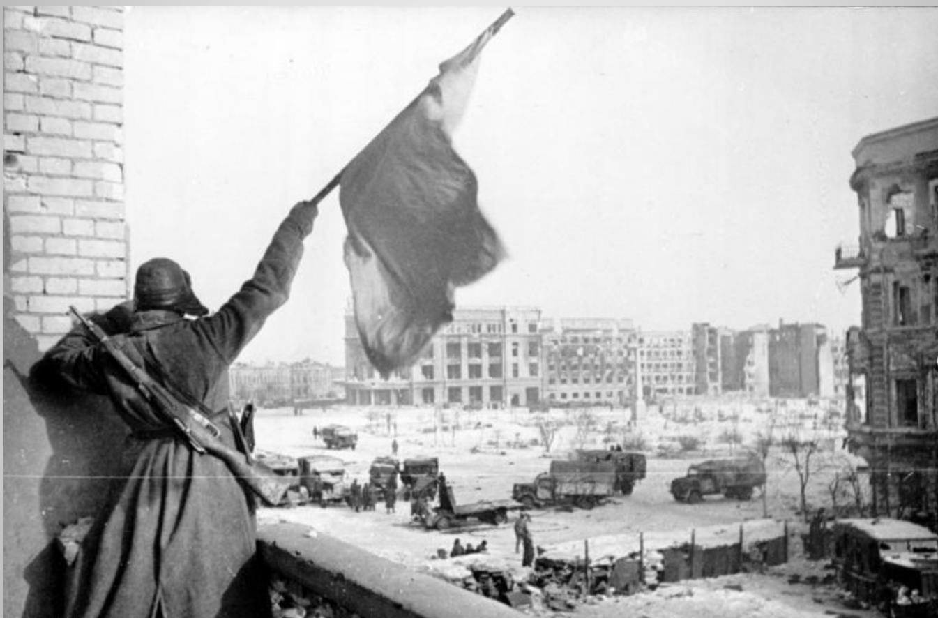
На фото: Флаг над освобождённым городом, Сталинград, 1943 год.