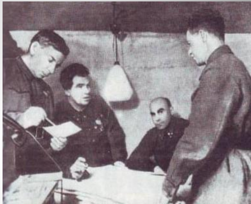
В штабе 62-й армии: Н.И.Крылов, В. И.Чуйков, К.А.Гуров, А.И.Родимцев

В июле, когда немецкие намерения стали совершенно ясны советскому командованию, оно разработало планы по обороне Сталинграда. На восточном берегу Волги были развёрнуты дополнительные советские войска. Была создана 62-я армия под командованием Василия Чуйкова, задачей которой стала защита Сталинграда любой ценой.