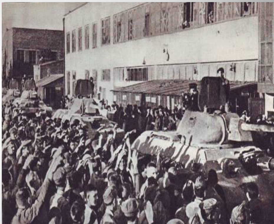
Танки с завода уходят на фронт.

Сталинградский тракторный приступил к выпуску танковых моторов, артиллерийских тягачей и средних танков Т-34.