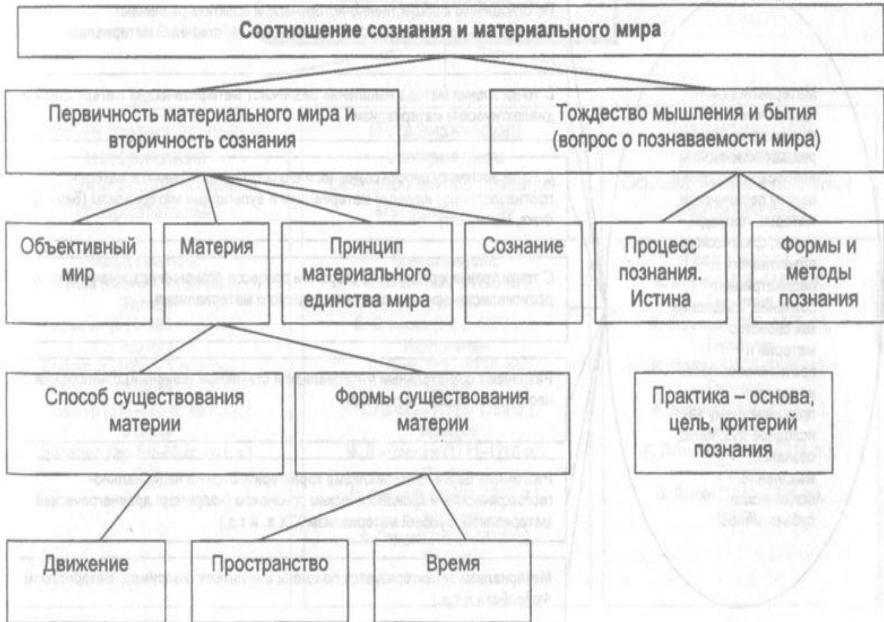
Схема 10. ОСНОВНОЙ ВОПРОС ФИЛОСОФИИ (схема его решения материализмом)