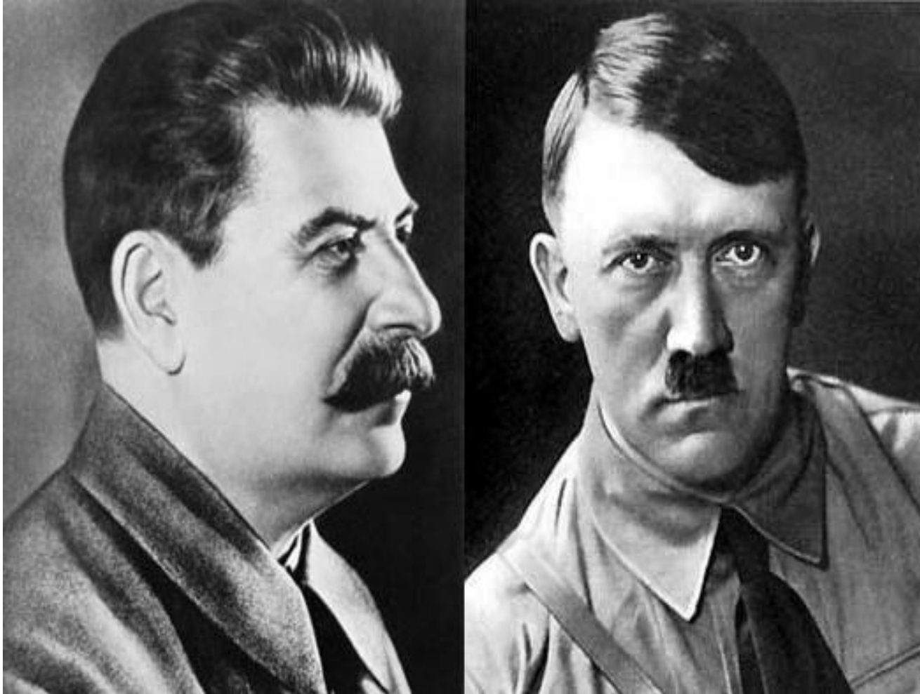
СССР – И.В. Сталин Германия – Адольф Гитлер