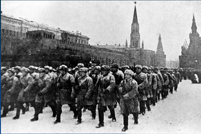
Битва за Москву